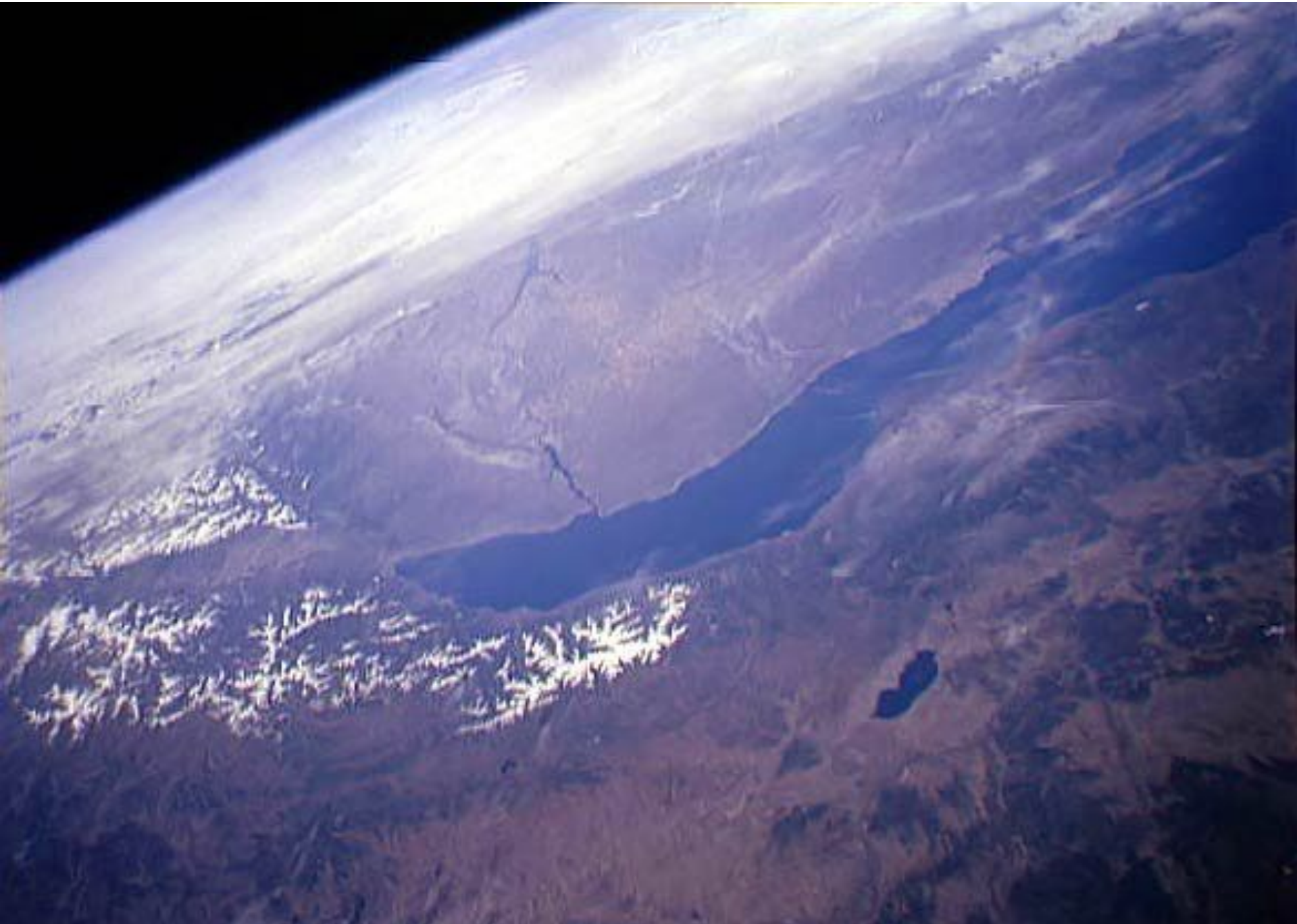
Байкал из космоса