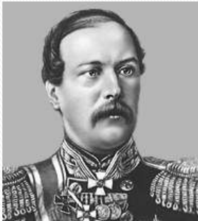
Тотleben Эдуард Иванович - главный военный инженер