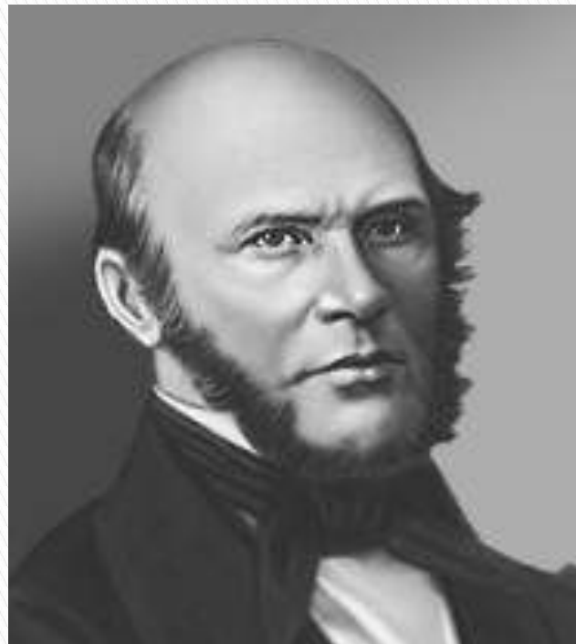
Пирогов Николай Иванович-главный хирург Севастополя