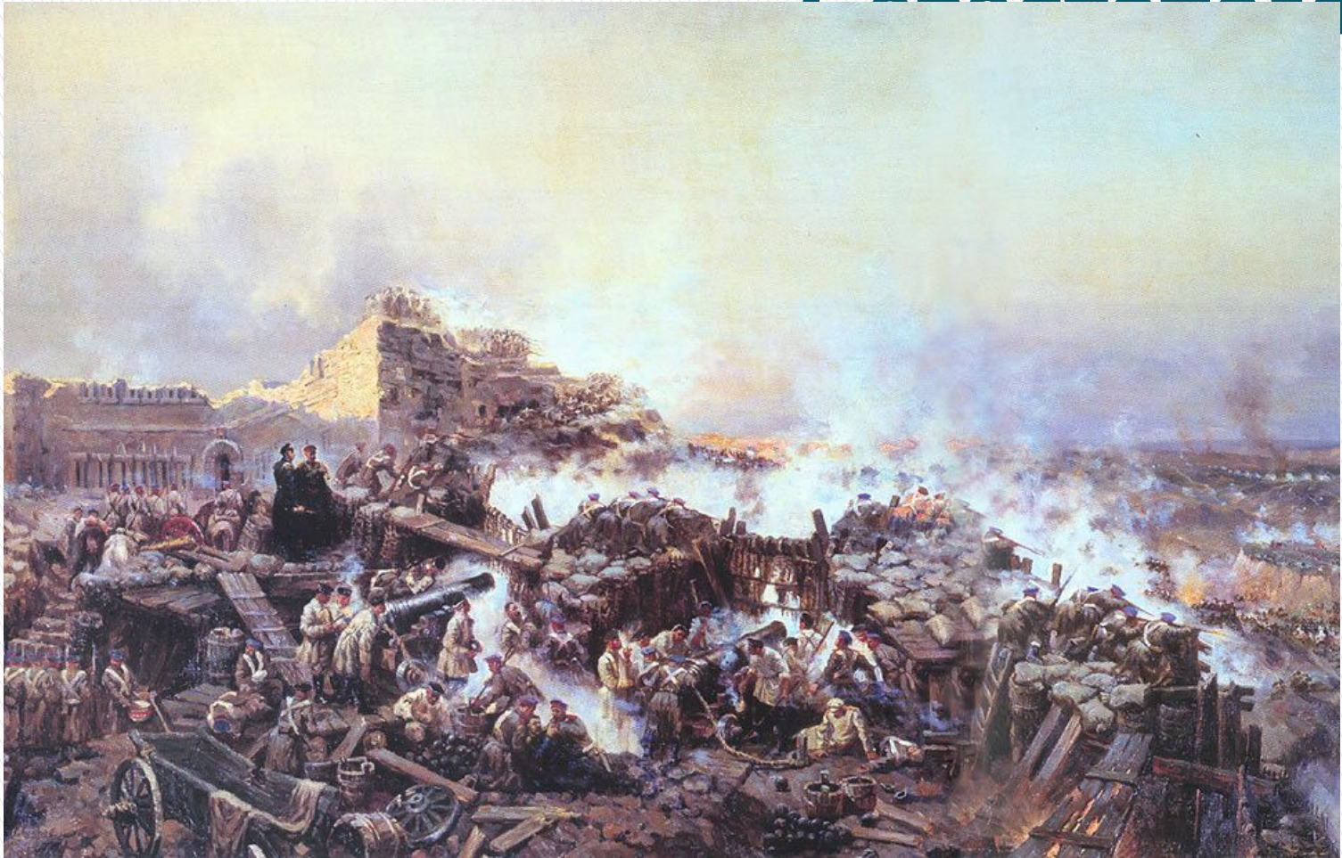
Бой за Малахов курган