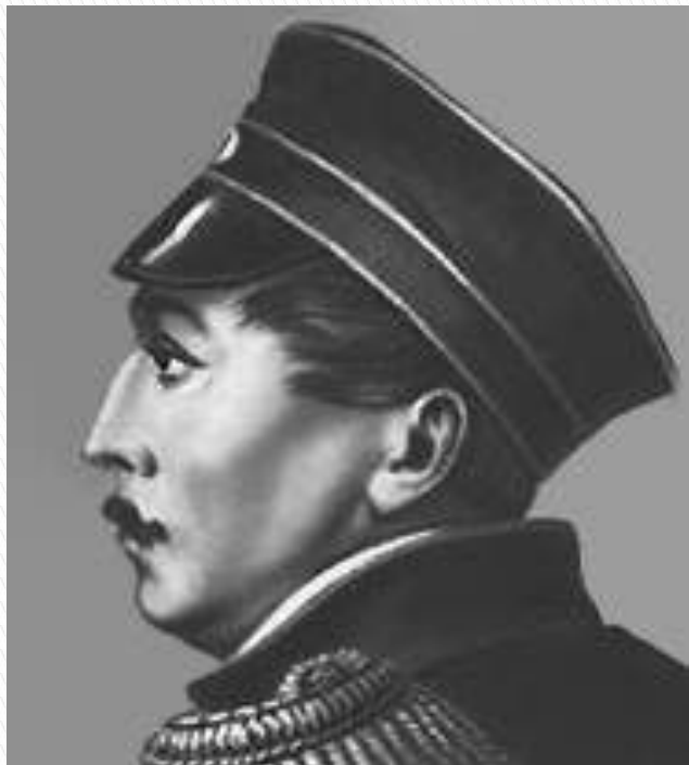
Нахимов Павел Степанович- вице адмирал-руководитель обороны Севастополя