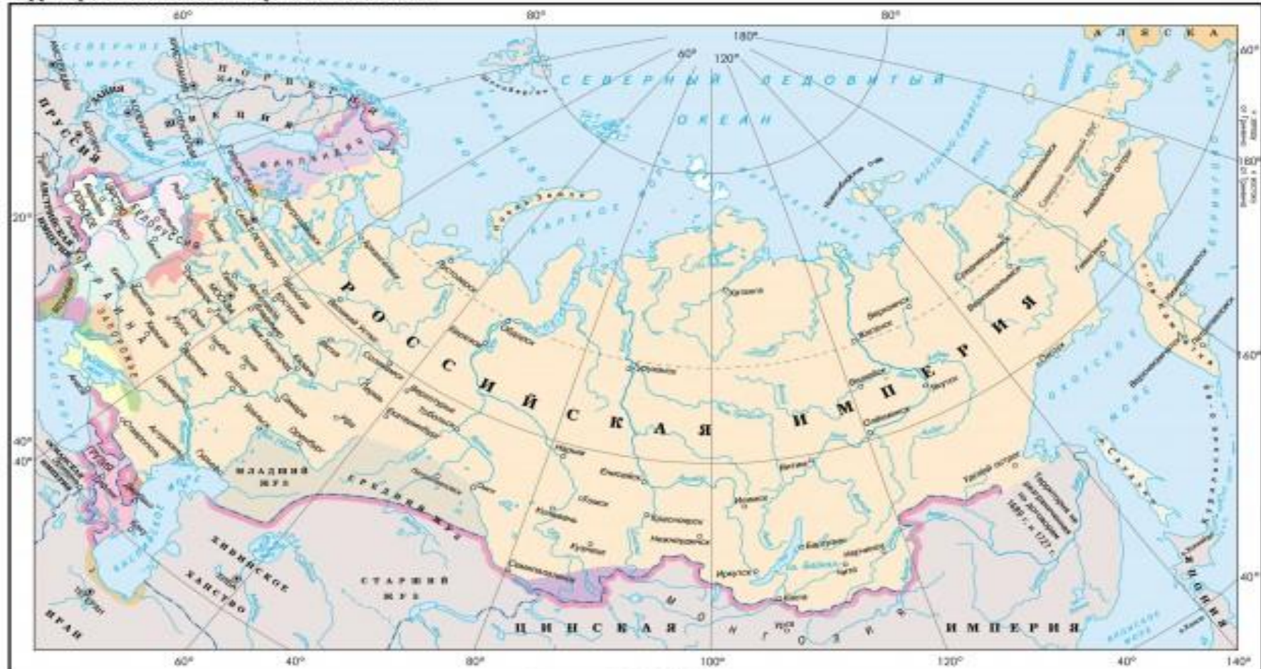
Масштаб 1:32 000 000