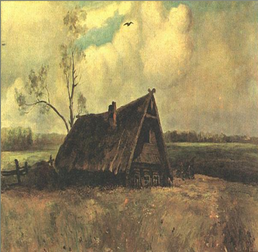
Изба, где проходил Военный совет в Филях