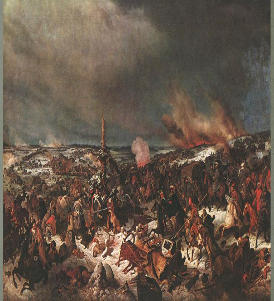
Отступление французов через Березину. Гесс, 1844 год

Попытка русской армии отрезать путь к отступлению Наполеону у переправы через р. Березину. Наполеон бежал в Париж за новой армией.