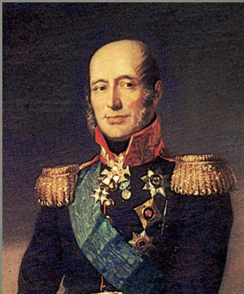
М. Б. Барклай-де-Толли.

1-ая и 2-ая русские армии соединились в Смоленске под командованием М. Б. Барклай- де-Толли.