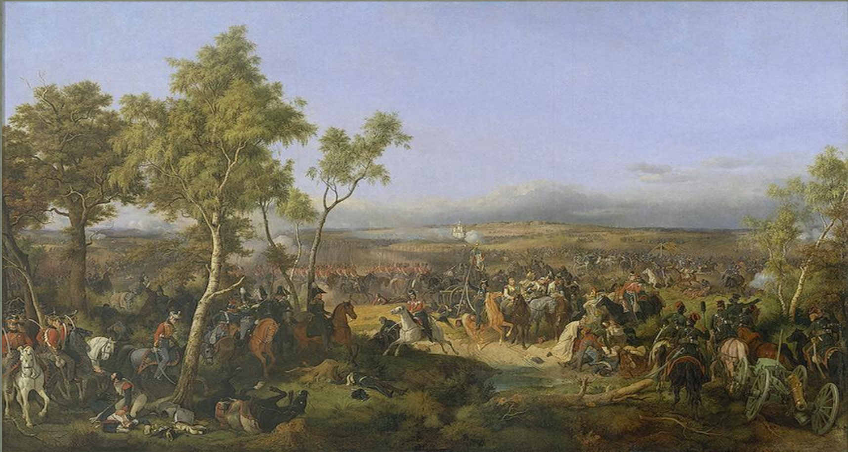
Сражение при Тарутино 6 (18) октября 1812 года. Гесс, 1847 год