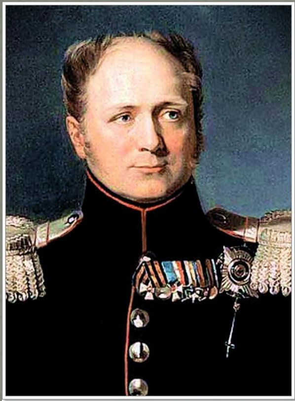
Император Александр I