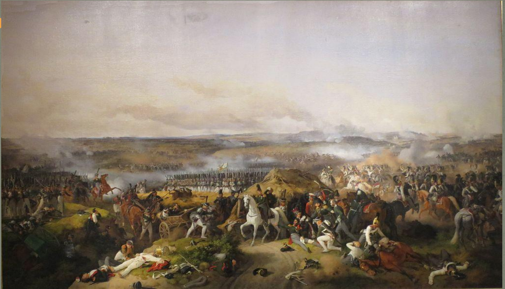
Бородинское сражение. В центре картины раненый генерал Багратион, Художник Петер Гесс, 1843