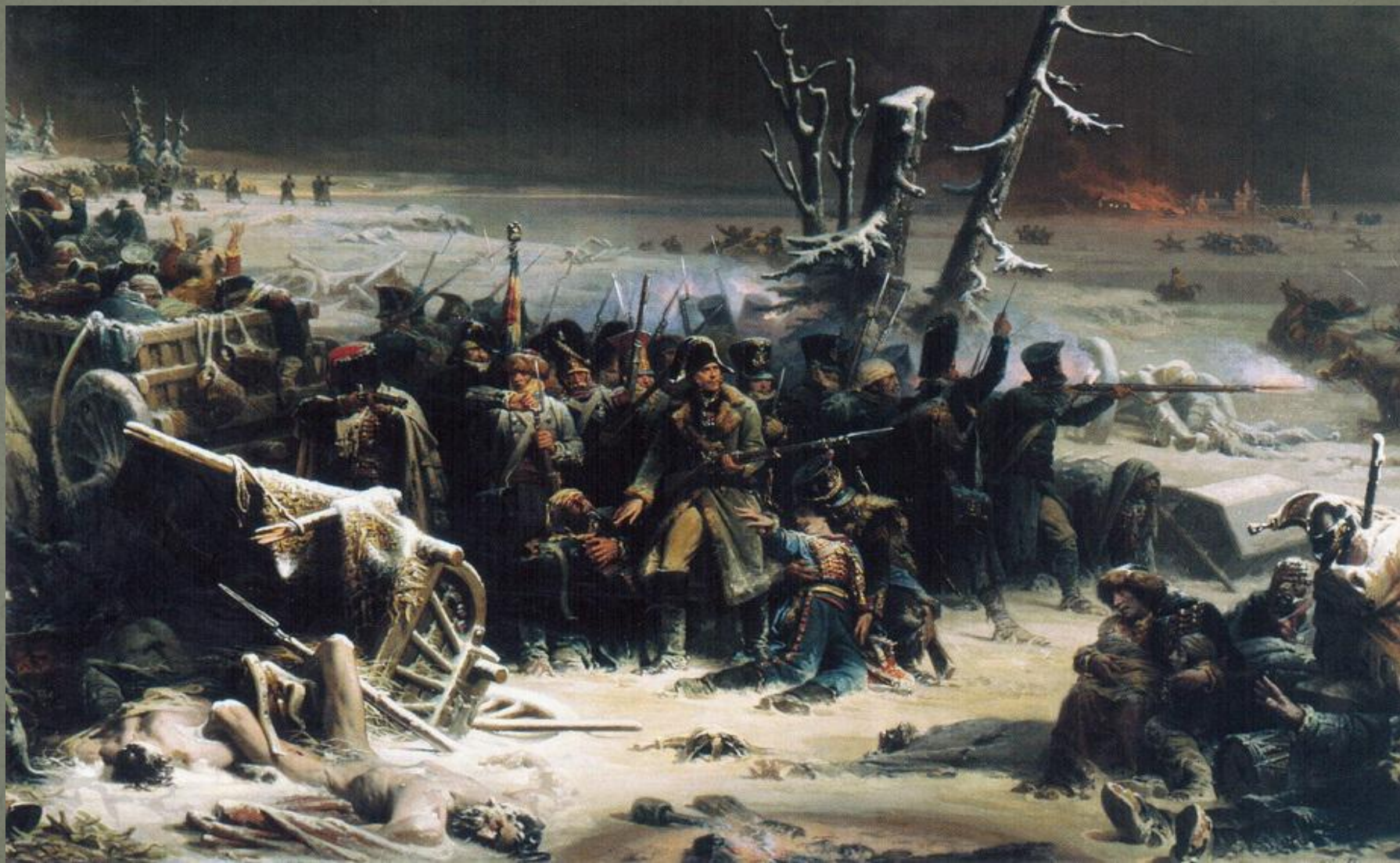
Французские солдаты маршала Нея загнаны в лес в сражении под Красным. А. Ивон.