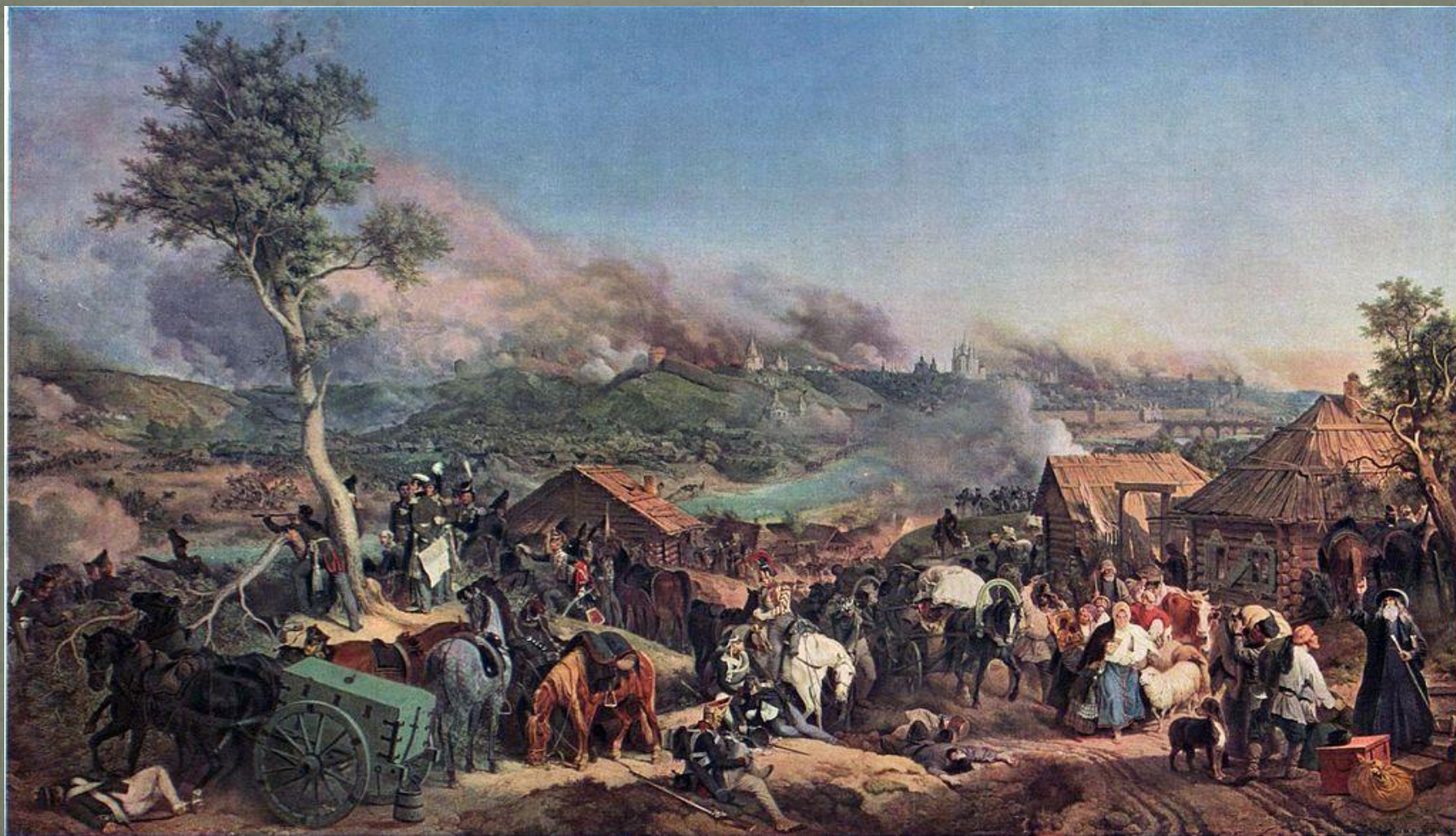
Сражение при Смоленске. Гесс, 1846 год