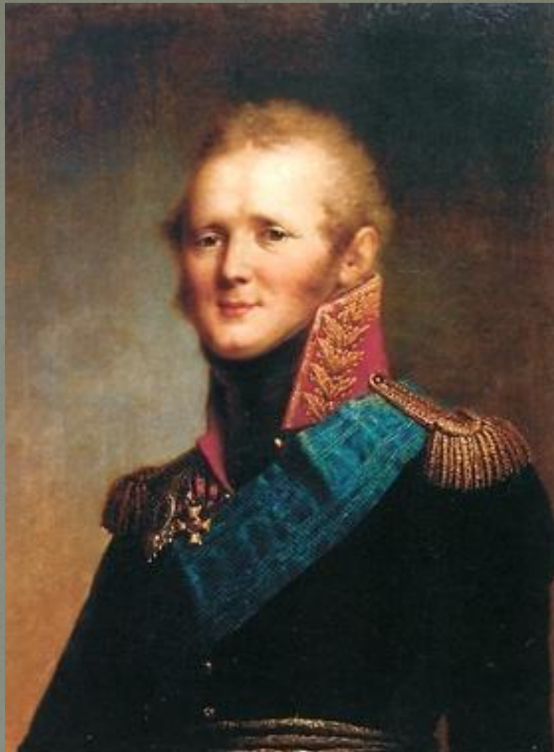
Александр I (1801-1825 г.п.)