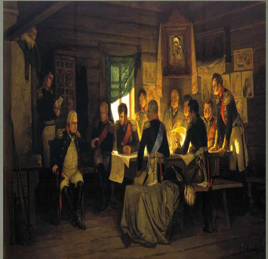
Военный совет в Филях, 1(13) сентября 1812 г.