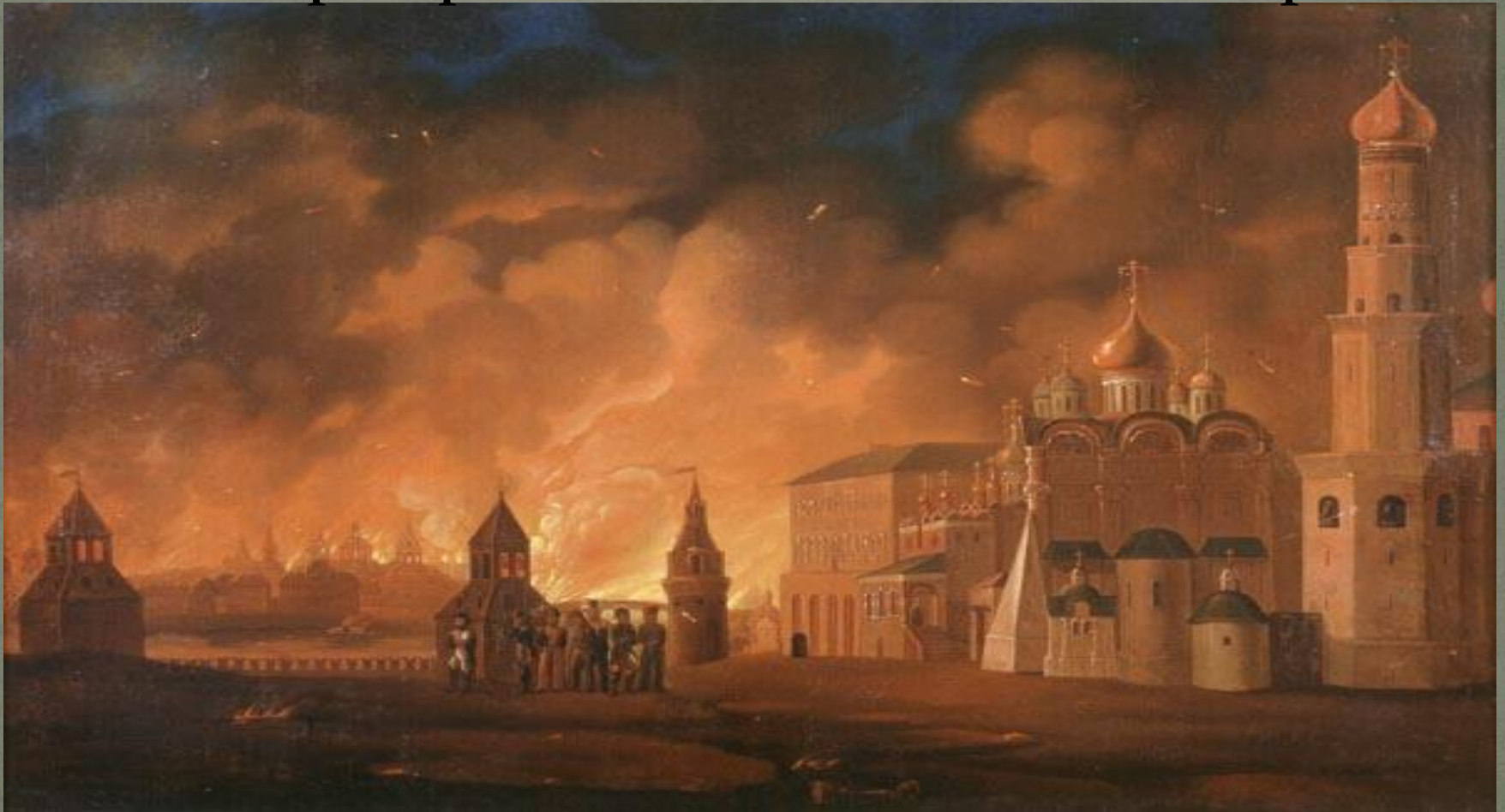
Пожар Москвы. А. Ф. Смирнов (1813)