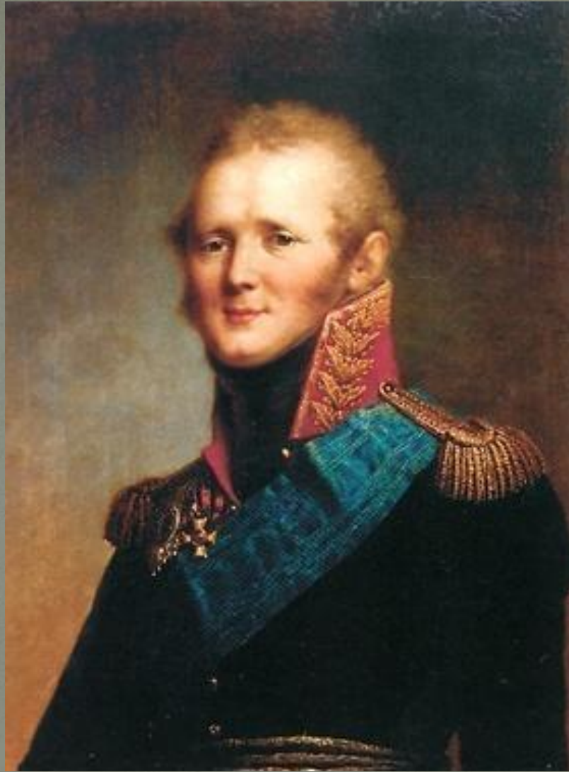
Александр I (1801-1825 г.п.)