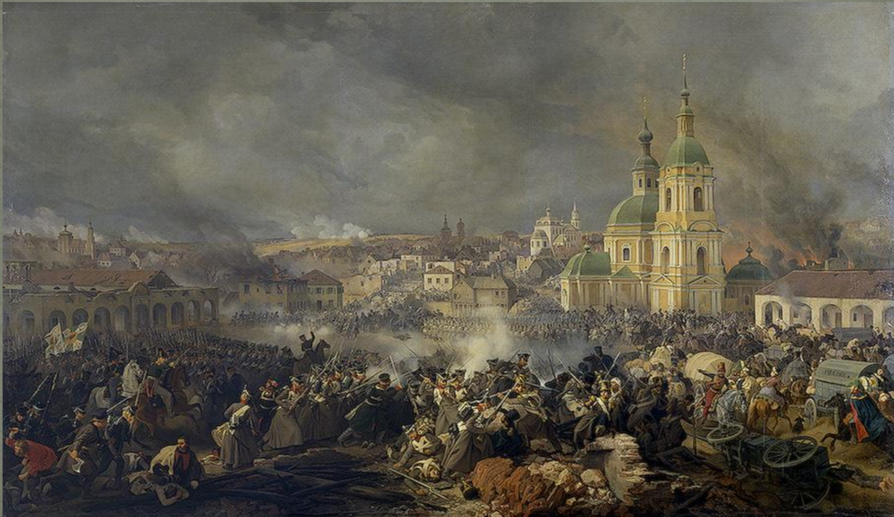
Сражение у г. Вязьмы.