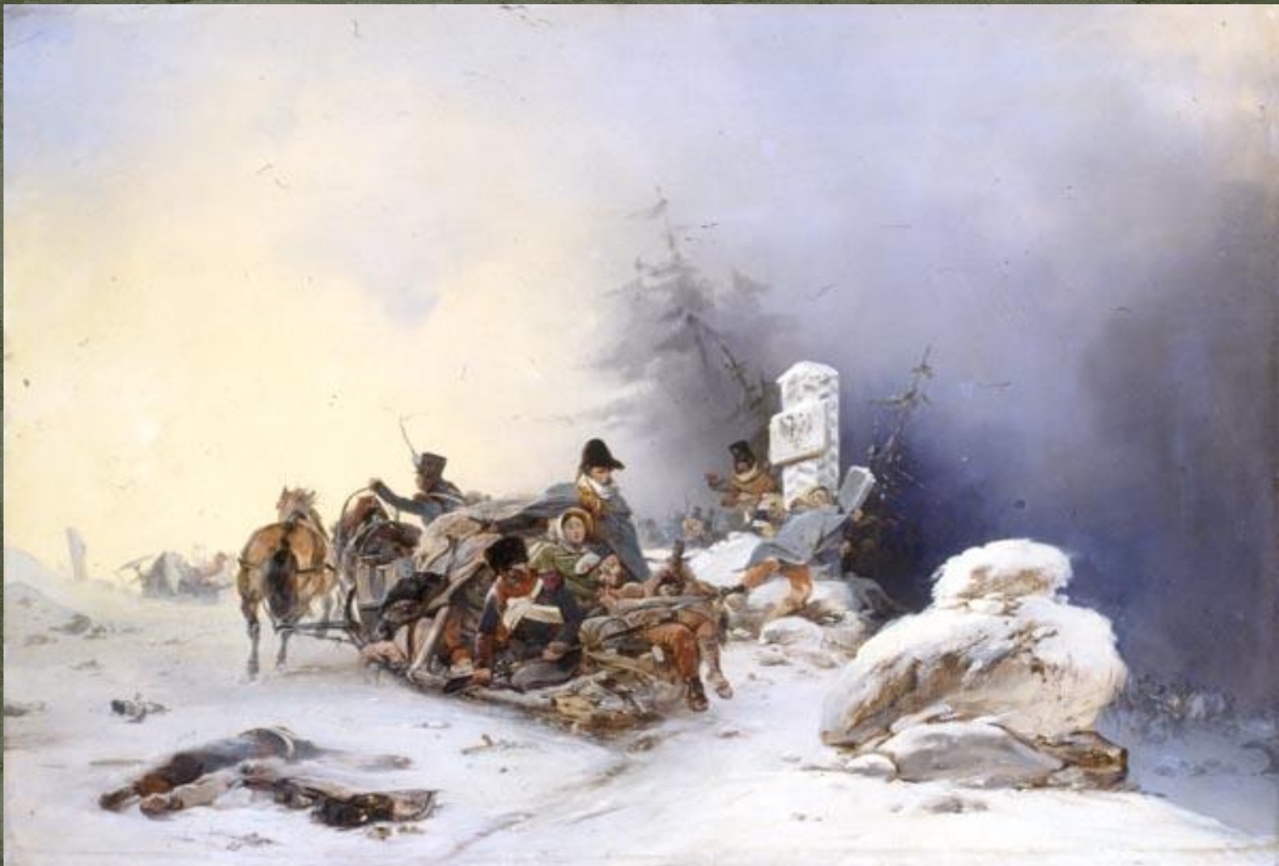
Бегство французов с семьями из России. Виллевальде, 1846