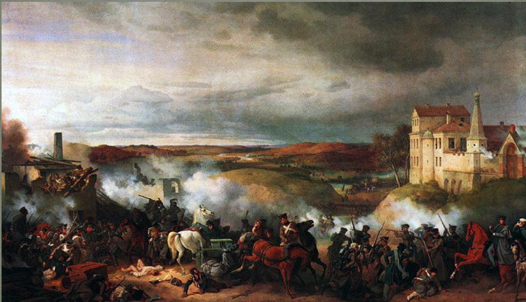
Сражение под г. Малоярославцем.

Отступление Наполеона по Смоленской дороге.