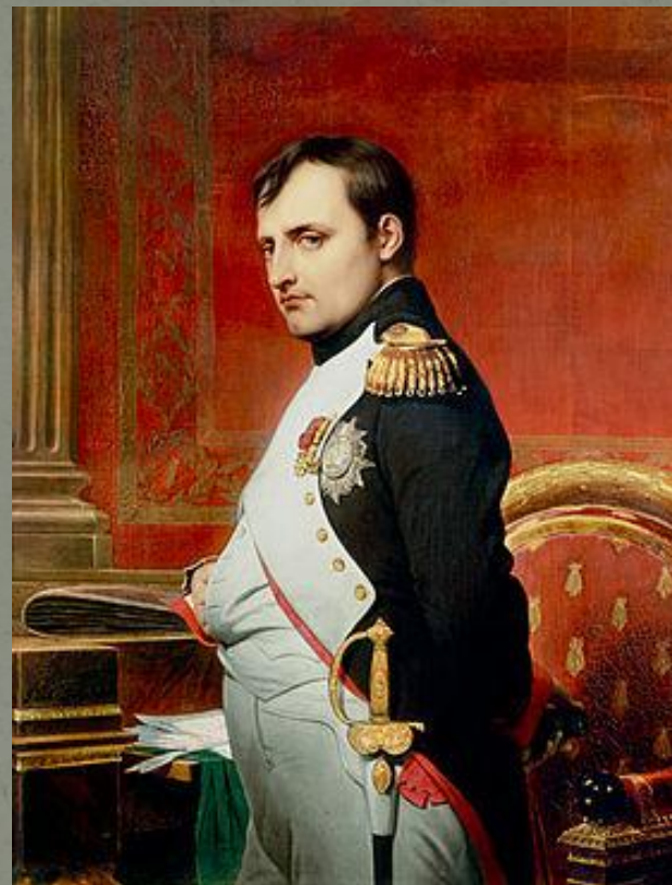
Император Наполеон I