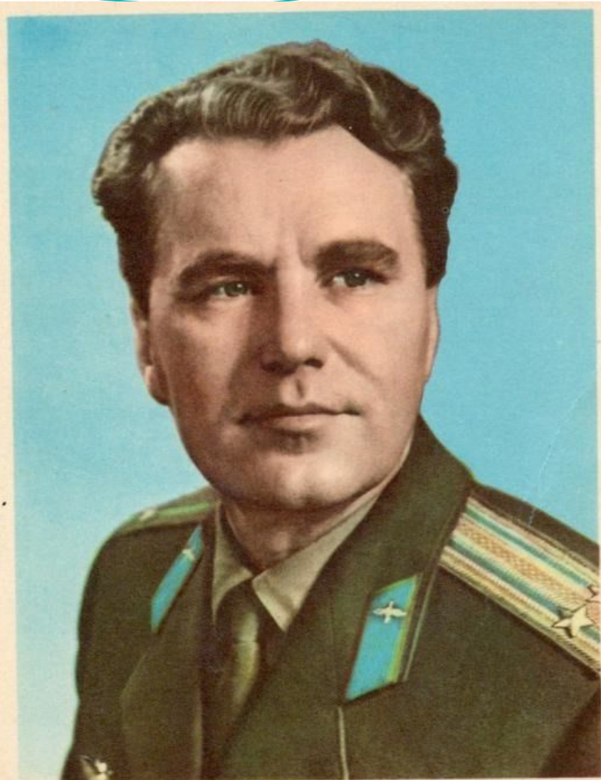
Гражданин Союза Советских Социалистических Республик, командир корабля «Союз-4», летчик-космонавт подполковник Владимир Александрович ШАТАЛОВ.

Дважды Герой Советского Союза, летчик-космонавт СССР В.А. Шаталов писал в своих воспоминаниях: «От чистого сердца, всю жизнь буду благодарен земле Казахстана. В трудные военные годы казахский народ заботился обо мне как о родном сыне».