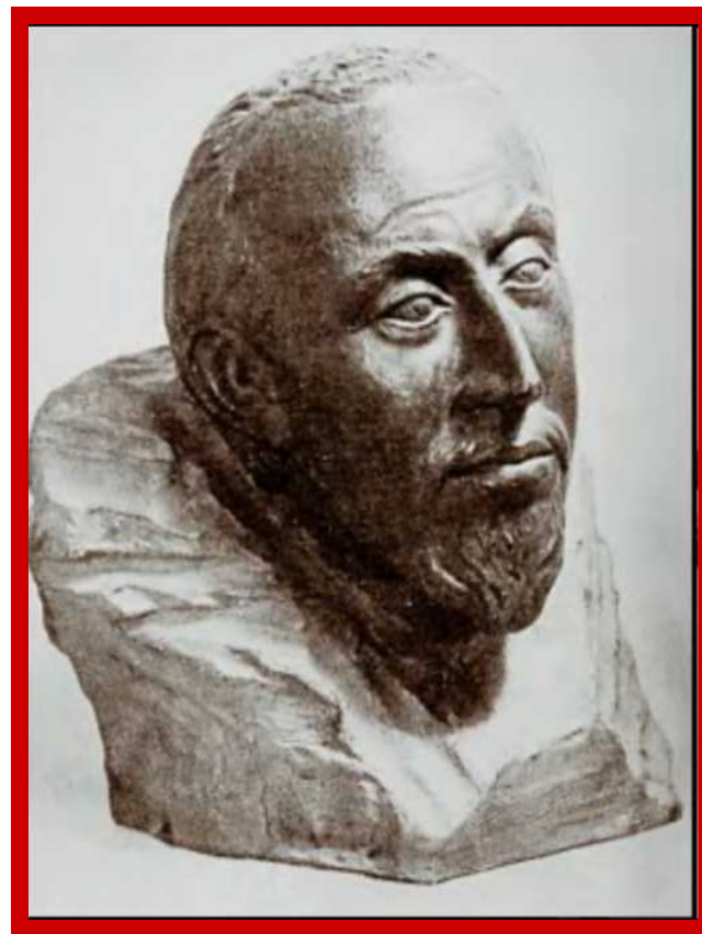
Царь Федор Иоаннович — реконструкция его облика по черепу, выполненная профессором М. М. Герасимовым.