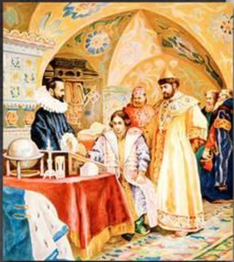
Борис Годунов и сын его Федор