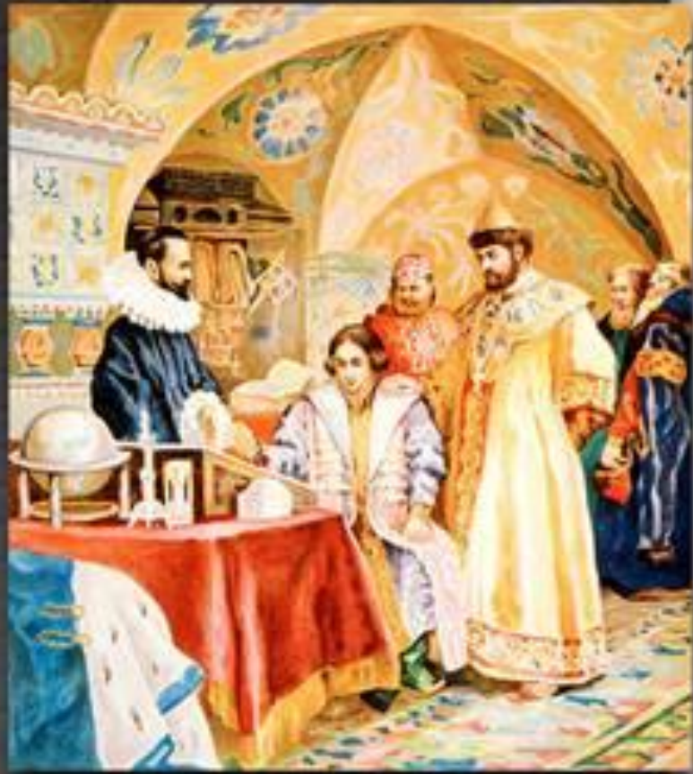
Борис Годунов и сын его Федор