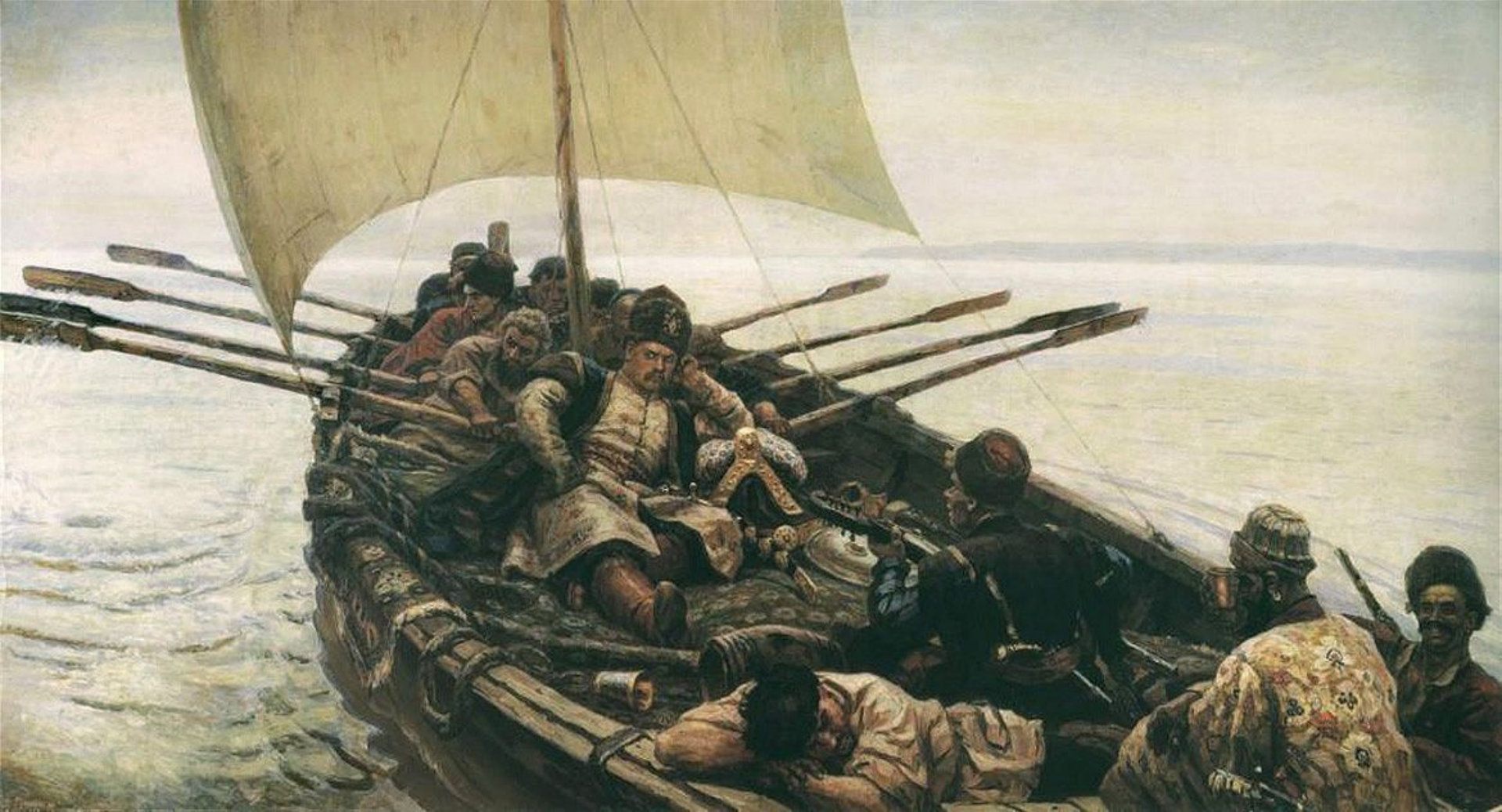
Степан Разин. художник Василий Суриков. 1903–1907.