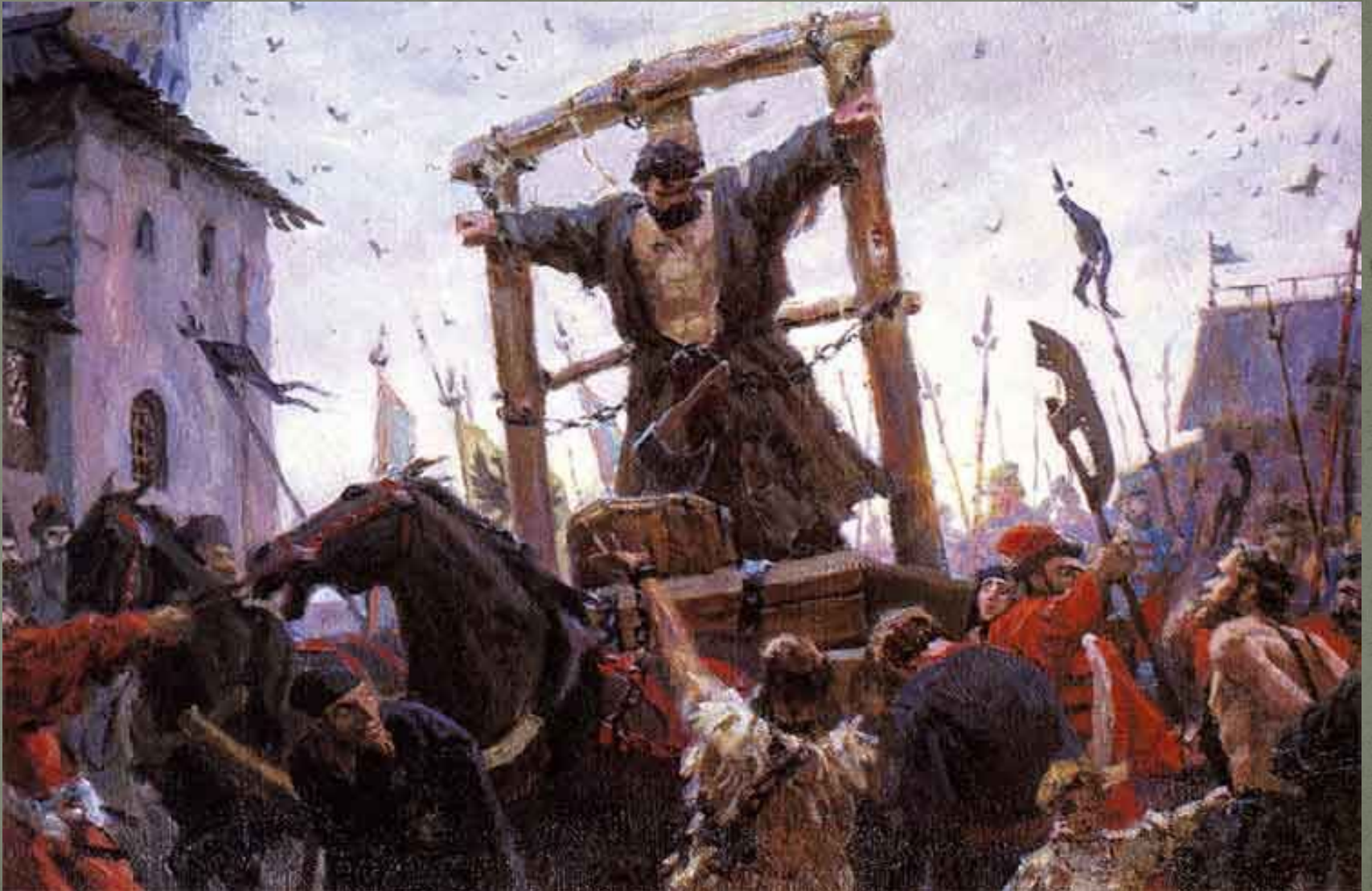
Казнь Степана Разина. Худ. С. Кириллов

В конце апреля 1671 года Разин вместе с младшим братом Фролом (Фролкой) донскими властями был выдан царским воеводам — стольнику Григорию Косонову и дьяку Андрею Богданову, которые доставили их в Москву (2 июня). Разин был подвергнут жестоким пыткам, во время которых сохранял непоколебимое мужество.