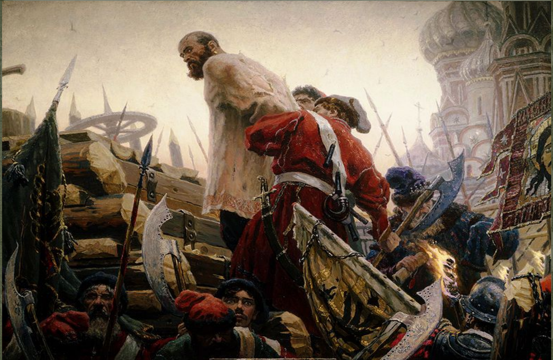
Степан Разин, картина Сергея Кириллова

6 июня 1671 Степан Разин после оглашения приговора был четвертован на эшафоте на Болотной площади.