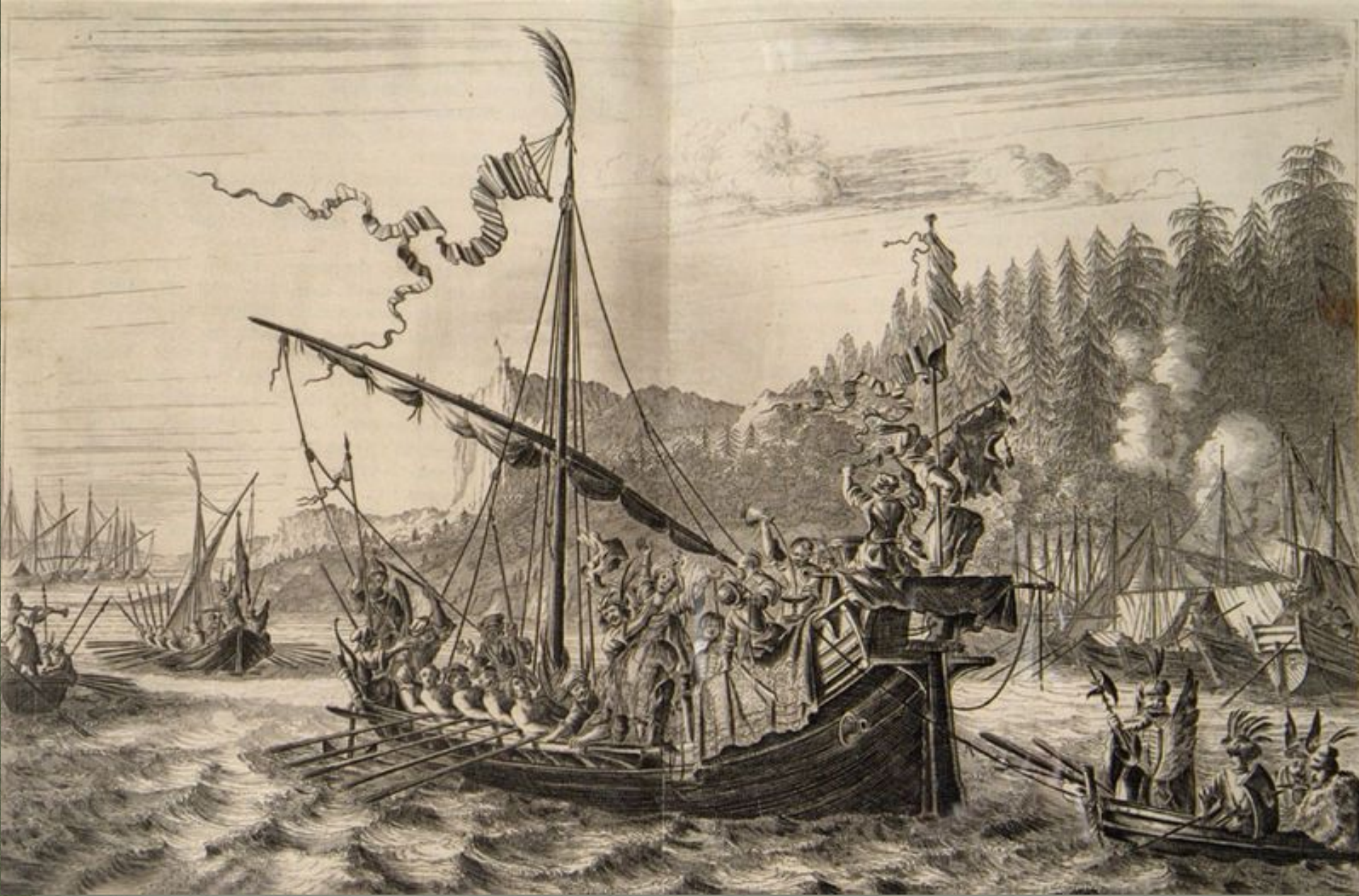
Степан Разин бросает персидскую царевну в Волгу