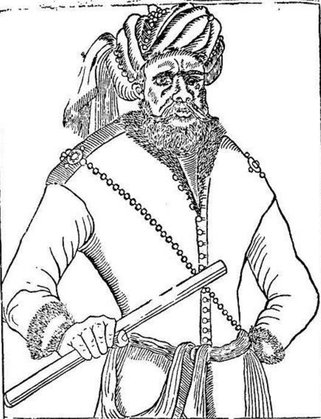
Степьянка Разин. Гравюра, приложенная к гамбургской газете 1670 г.