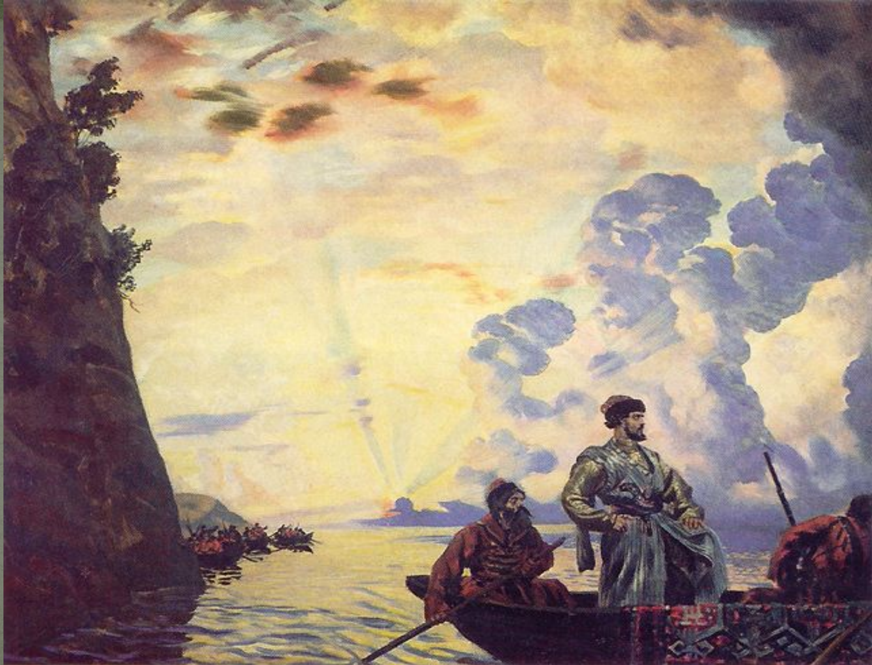
Степан Разин, картина Бориса Кустодиева