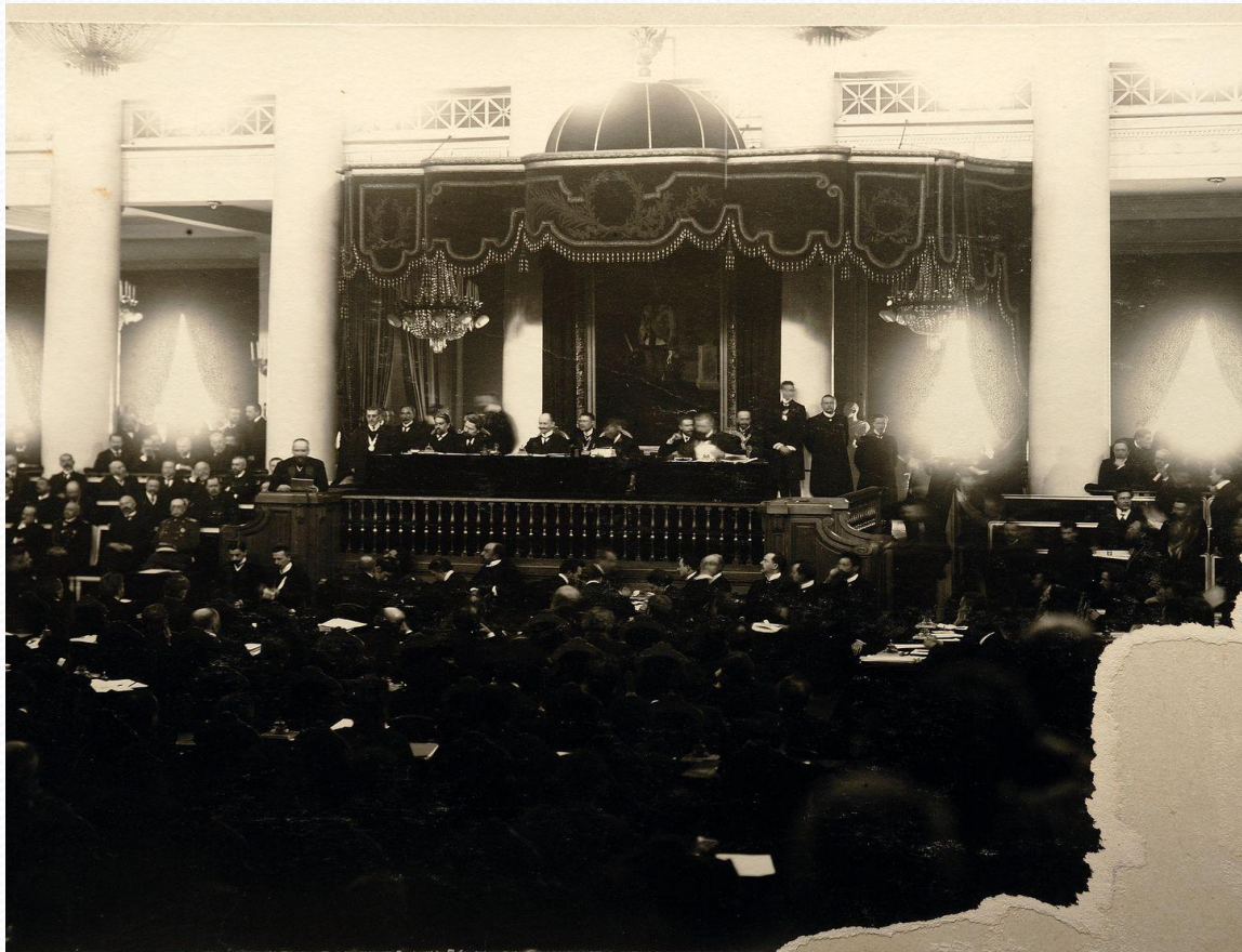
П.А.Столыпин произносит речь декларацию во второй Государственной Думе 6 марта 1907 г.

русский государственный деятель [2(14).4.1862, Дрезден, Германия, — 5(18).9.1911, Киев]