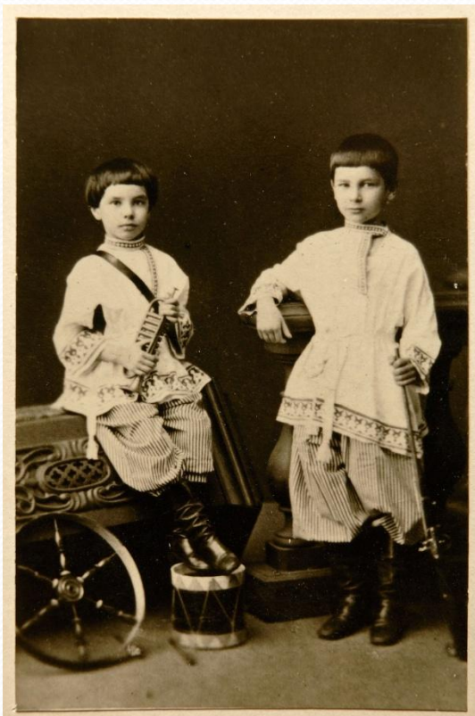
Петр Столыпин семи лет с братом в 1869 г.