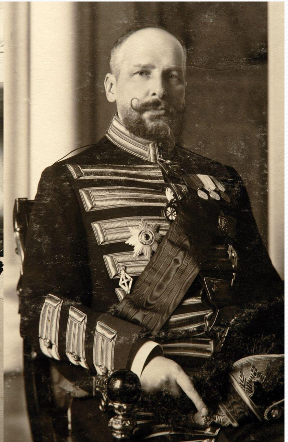
П.А.Столыпин в Зимнем дворце в 1908 г.