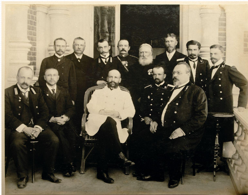
П.А.Столыпин – Саратовский губернатор в поездке в г. Камышинь 1903 г.