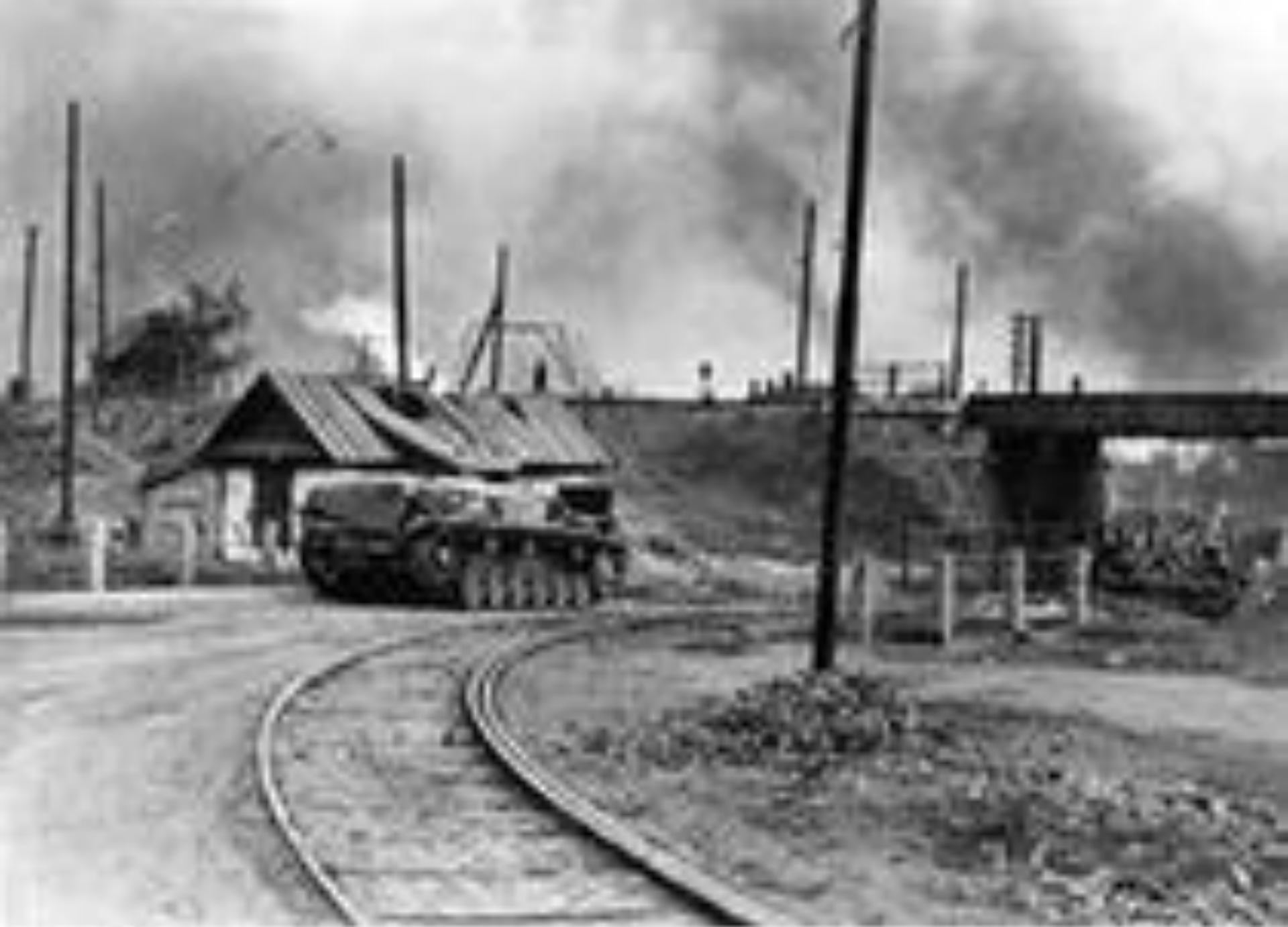
INDUSTRIAL SITE, 1940 BY [unreadable]