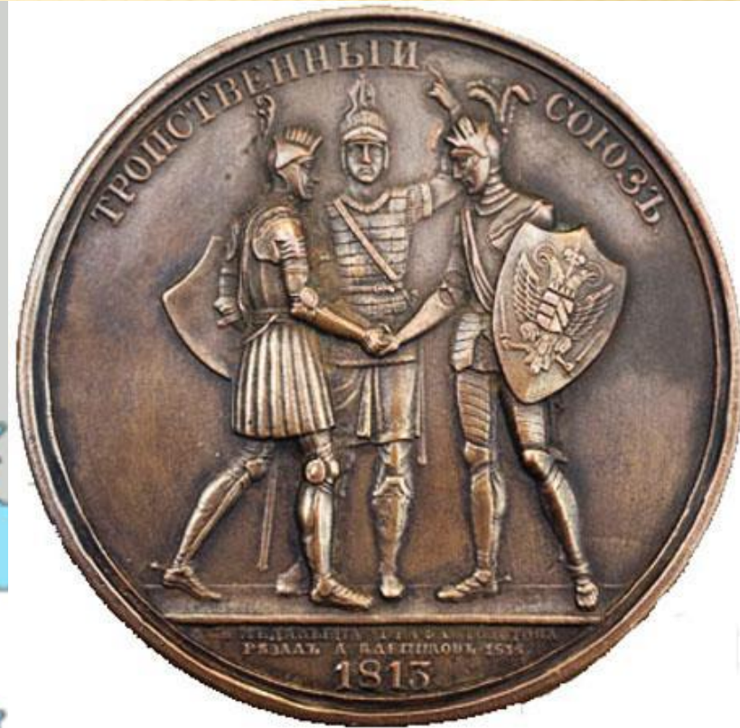
Медаль «Тройственный союз»