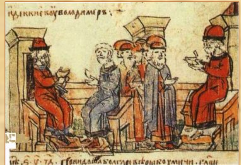
Изложение своей веры князю Владимиру мусульманами