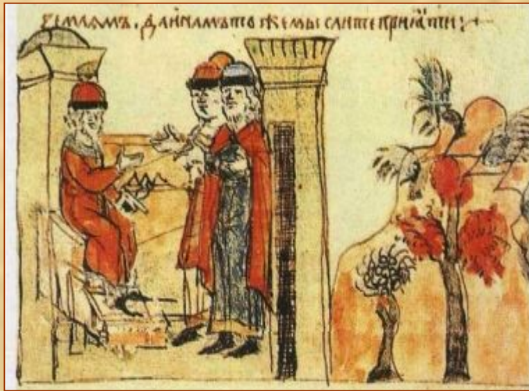
Изложение князю Владимиру своей веры хазарами