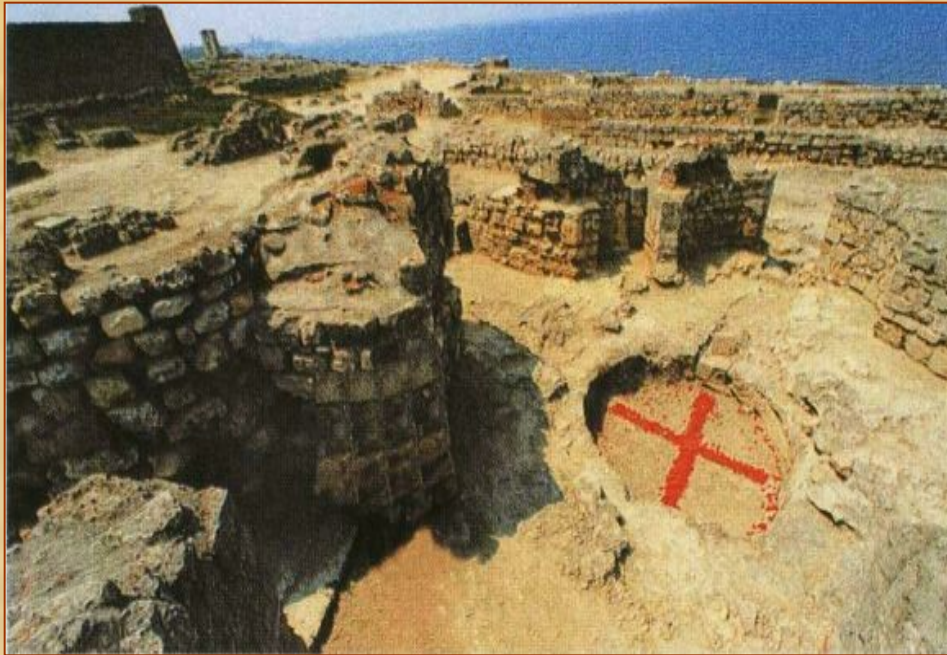
Купель баптистерия, где принял крещение князь Владимир. Раскопки в Херсонесе (Корсуни)

В назначенный день произошло массовое крещение киевлян у места впадения в Днепр реки Почайны.