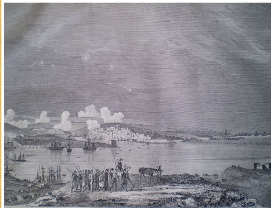
Севастополь в 1854 году

[Пирогов, Н. И. Севастопольские письма и воспоминания / под ред. С. Я. Штрайх. - М.: Академия наук СССР, 1950.- 652 с.]