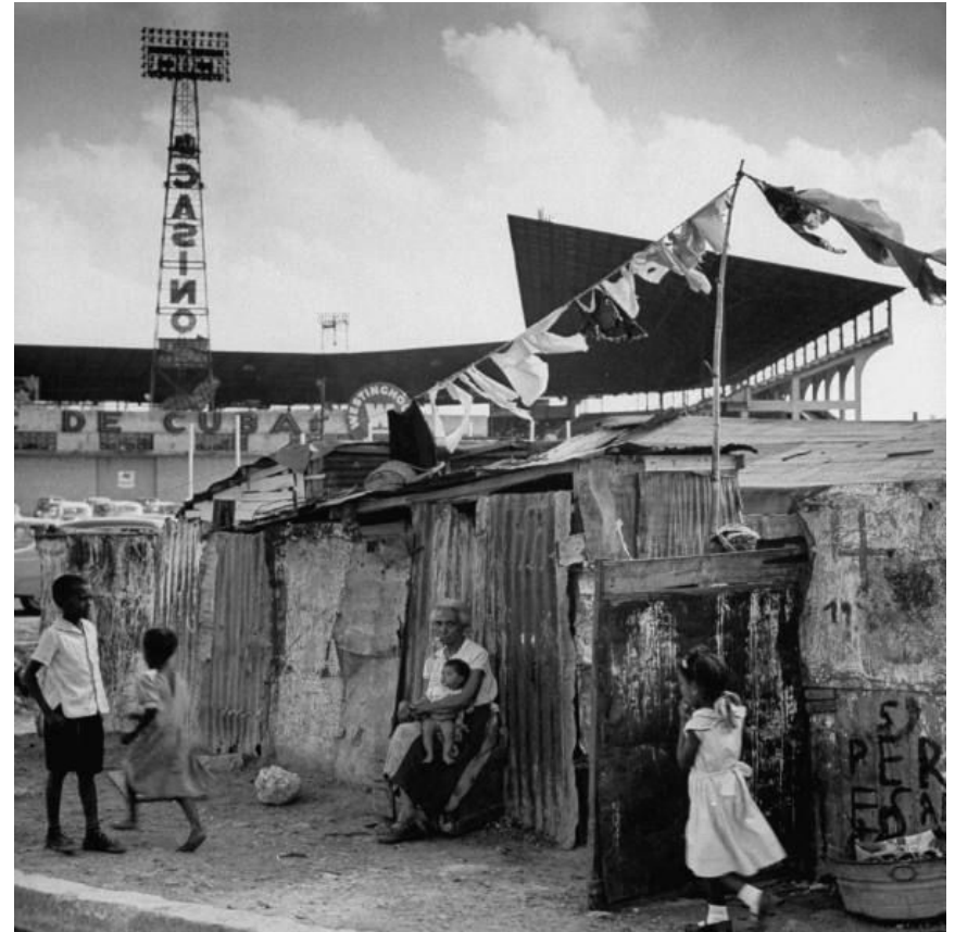
Трущобы в Гаванне, 1954 г.