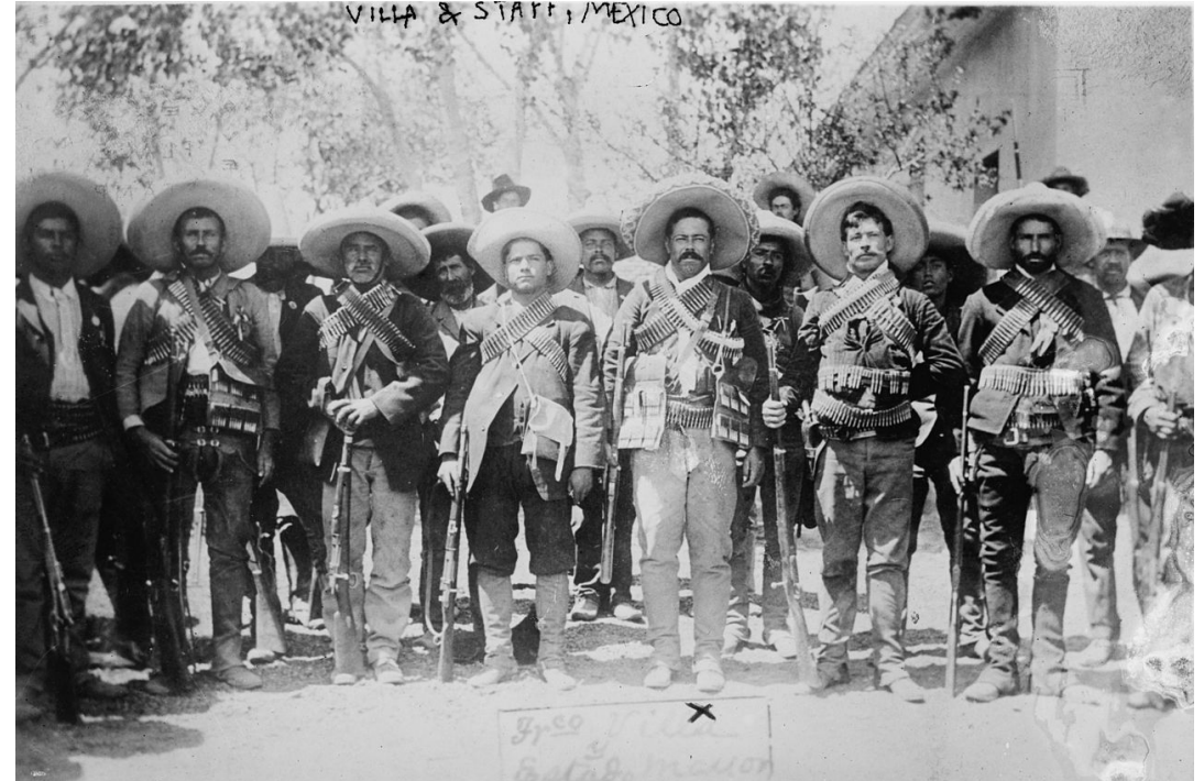
Группа мексиканских революционеров, 1914 год