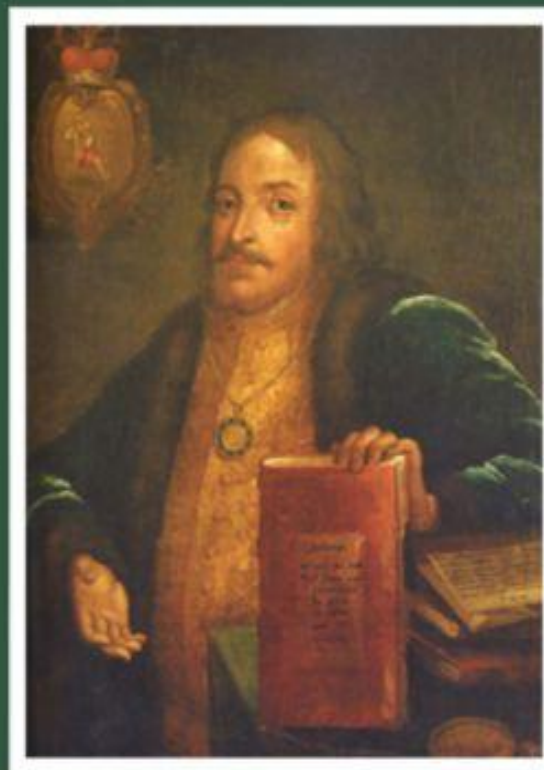
Василий Васильевич Голицын – русский политический деятель, возглавивший Крымские походы.