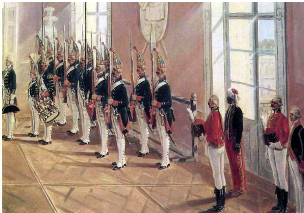
200-летию 1812-го года посвящен проект «Слава России». Проект: И. Булгаков. Фото: И. Булгаков. Фото: И. Булгаков.