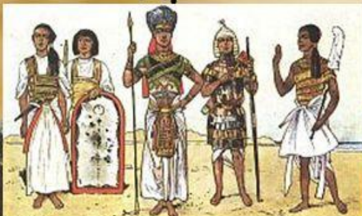
Фараон и его двор