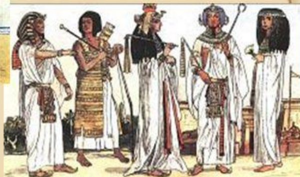
Вельможи, жрецы, храмовые служители, свита фараона.