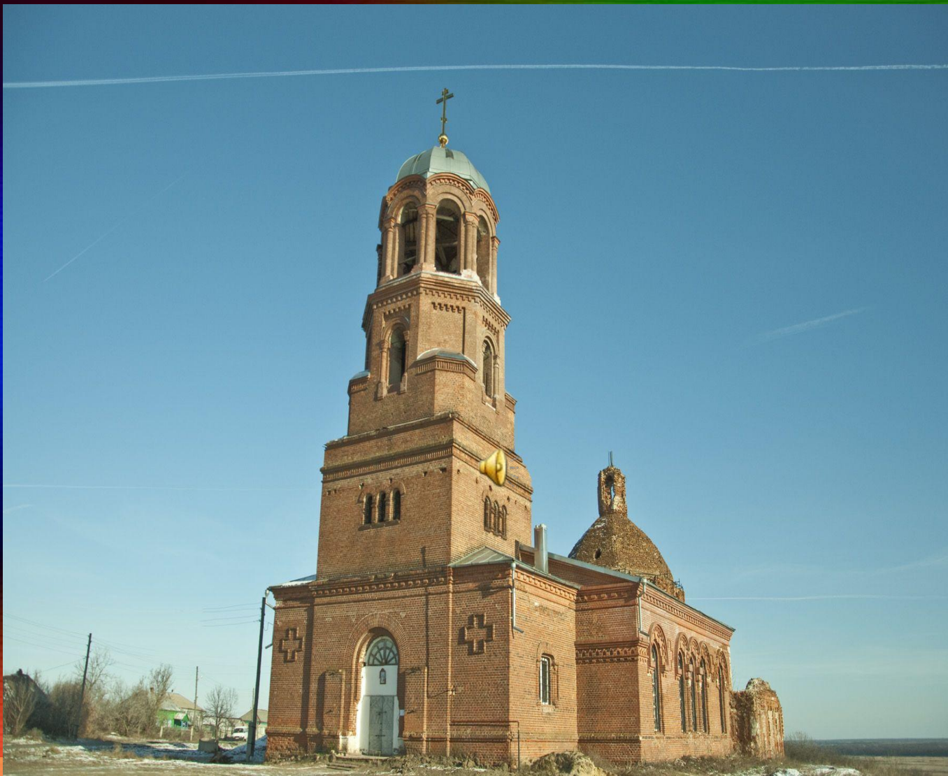
Покровский храм г. Боброва