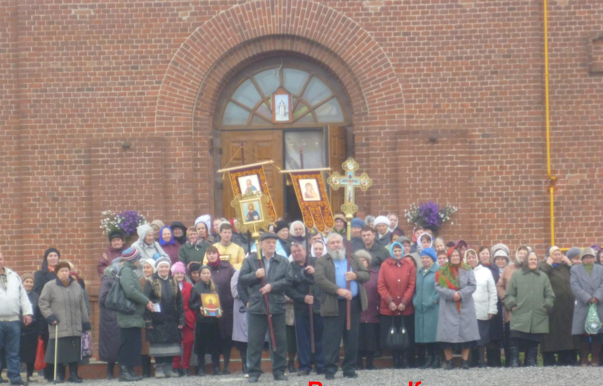
Встреча Крестного хода из Успенского храма