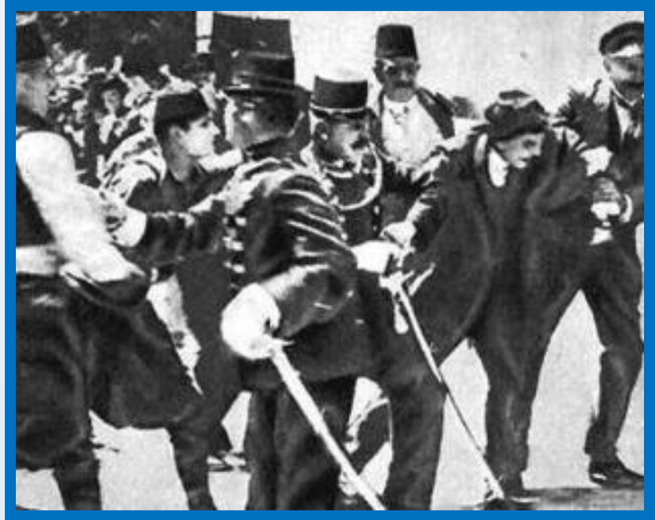
Арест Гавриила Принципа

Все они преследовали агрессивные цели, но основная ответственность легла, на Германию, стремившуюся разгромить Францию и Россию и завладеть английскими и французскими колониями.