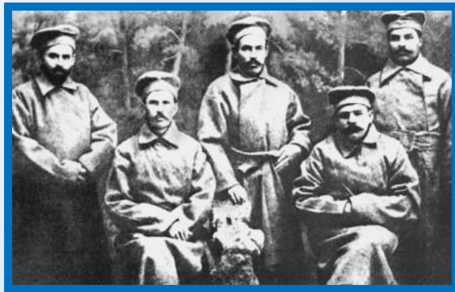
Большевики Депутаты IV Думы

Дума приняла решение о поддержке правительства в войне, но среди левых единства не было. Часть относилась к патриотам , 2-я группа объявила себя пацифистами , а большевики, считая войну империалистической, заняли пораженческую позицию , призывая повернуть штыки против правительств, начавших мировую бойню. Дума осудила их позицию. Большевистская фракция была лишена депутатской неприкосновенности и отдана под суд.