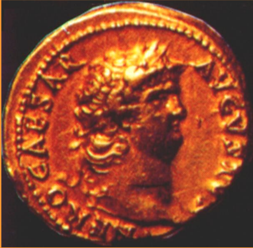
Древнеримская монета с изображением Нерона

В 1 в.н.э. Римская импе-рия достигла вершины своего могущества.