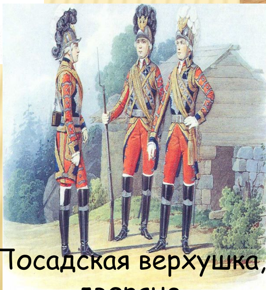
Посадская верхушка, дворяне