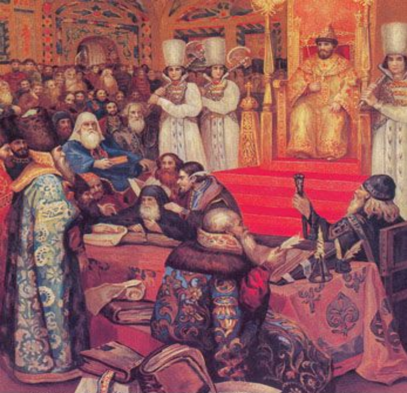
Н.Ф.Некрасов Составление Соборного Уложения при царе Алексее Михайловиче. 1649 г.

Результат: Уступки со стороны царя Алексея Михайловича. Созыв Земского собора, принятия в 1649 году Соборного Уложения – новый свод законов.