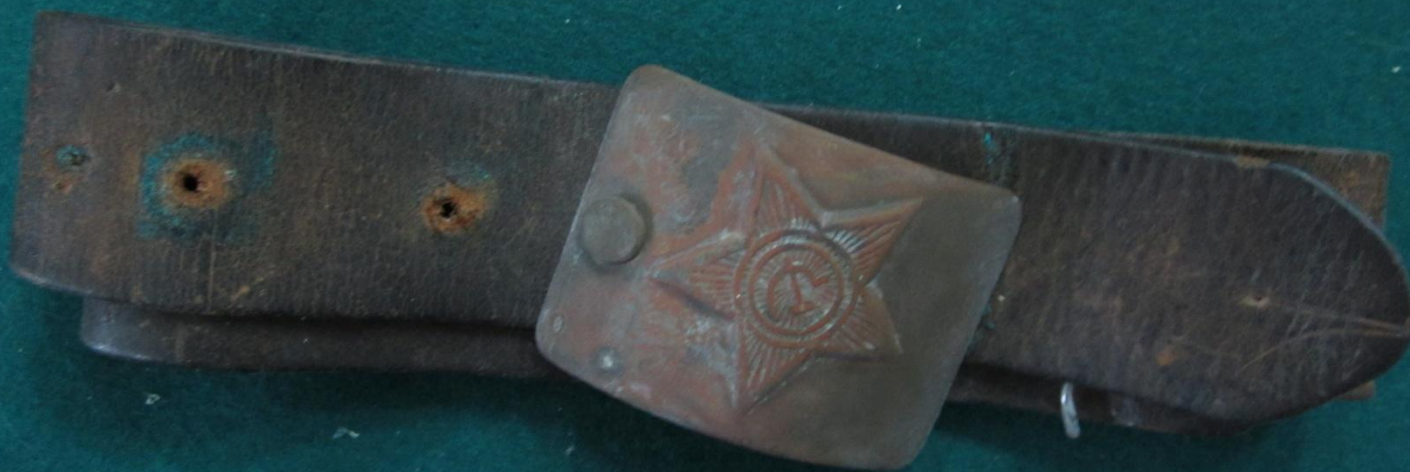
Солдатский ремень Ушакова А.М. Плываншетка Ушакова А. М.