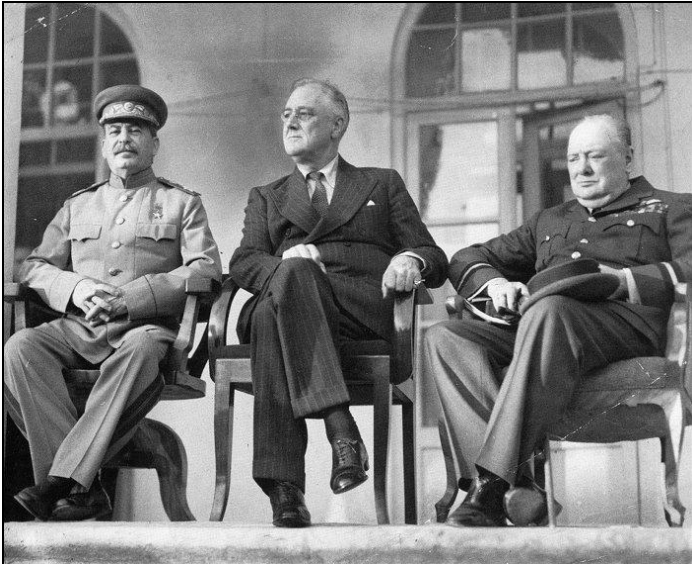
И.В. Сталин, Ф.Д. Рузвельт, У. Черчилль