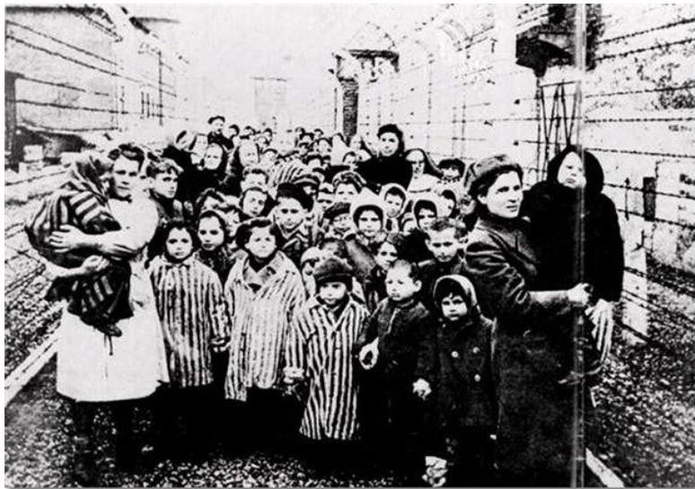
Освобожденные узники Освенцима