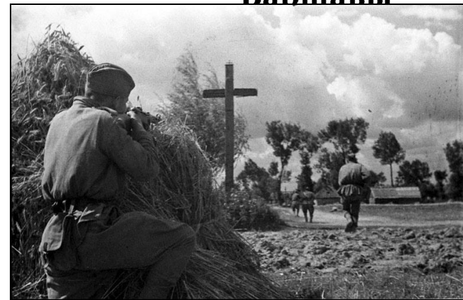
Бои у г. Познань