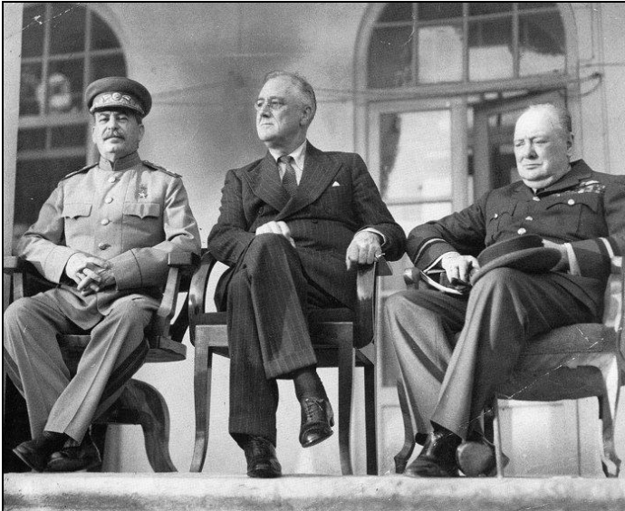
И.В. Сталин, Ф.Д. Рузвельт, У. Черчилль