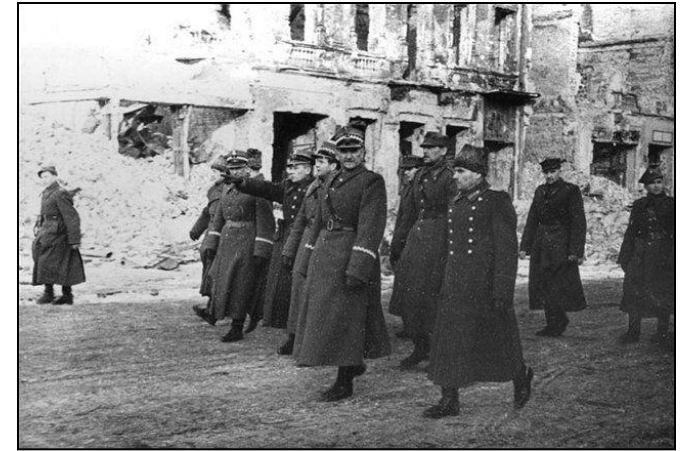
Советские и польские офицеры на улицах Варшавы

Освобождение Польши и перенос действий на территорию Германии