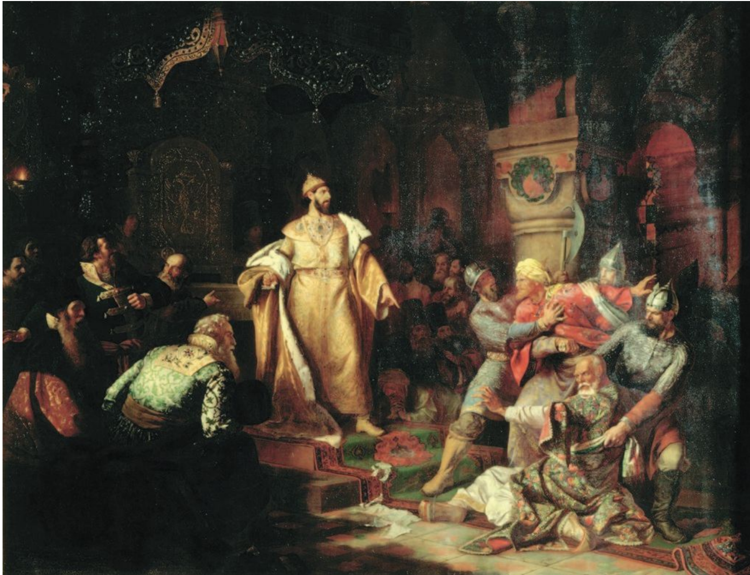
Иоанн III разрывает ханскую грамоту. Худ. Н.С. Шустов. 1862г.