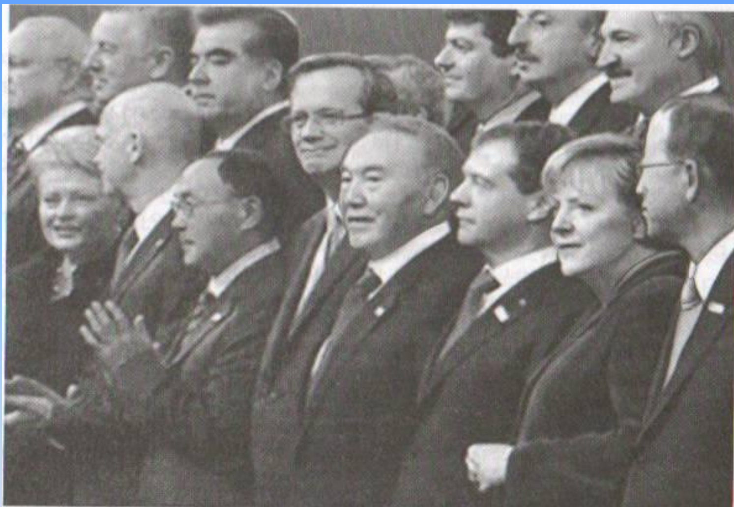
Саммит ОБСЕ. Астана 2010 г.