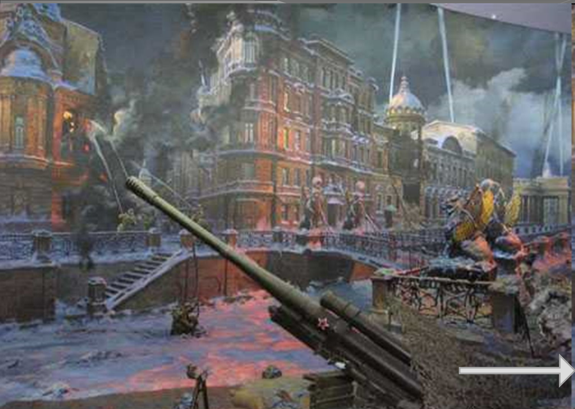
ДИОРАМА "БЛОКАДА ЛЕНИНГРАДА" В МУЗЕЕ НА ПОКЛОННОЙ ГОРЕ В МОСКВЕ