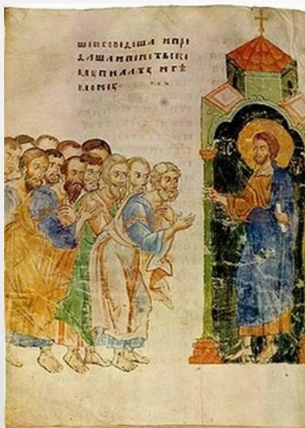
Отослание апостолов на проповедь. Миниатюра из Сийского Евангелия 1339 г. – древнейшей московской рукописи.

Книги украшались небольшими изящными картинками, иллюстрирующими текст- миниатюрами.