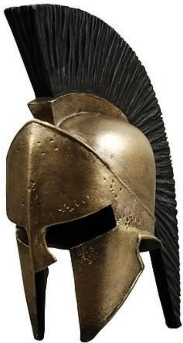
Спартанский гоплит сер. 5 века до н.э.