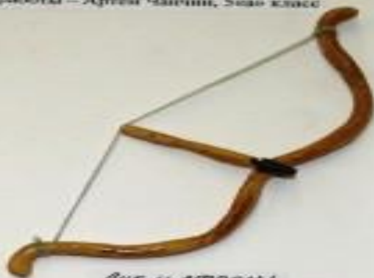
Лук и стрелы