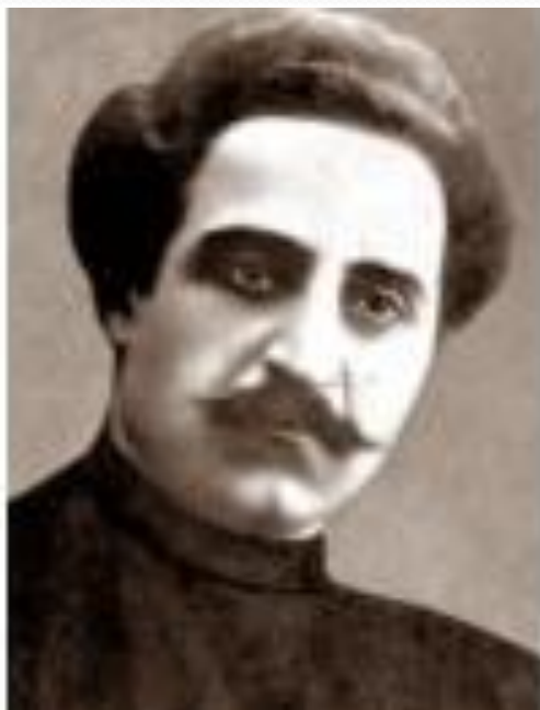
Григорий Константинович Орджоникидзе

В5. Прочитайте отрывок из текста и определите и укажите фамилию политического деятеля, о ком идет речь.