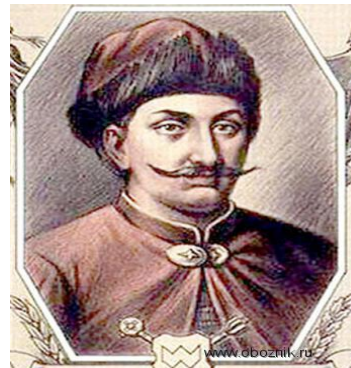
Казацкий вождь Заруцкий И.М.