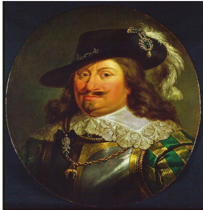
Польский королевич Владислав