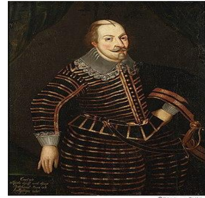
Шведский королевич Карл-Филипп