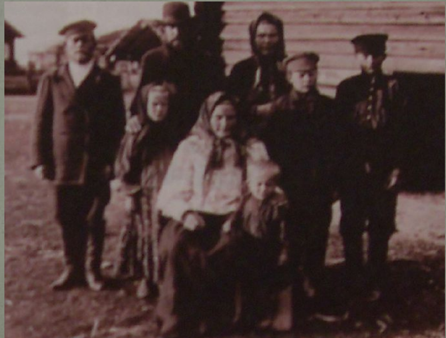
Крестьянская семья. Начало XX века