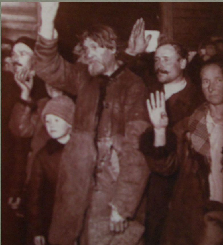
Крестьяне голосуют за вступление в колхоз. Фотография 1928 года.

В стране началась коллективизация, которая коснулась и жителей хутора. Людям предложили вступать в колхозы, в коммуны. За отказ вступать в колхоз человека лишали избирательного права и раскулачивали. Жители вынуждены были бросить насиженные места, хозяйство и уехать. Усадьбы были разобраны и перевезены в Криушу.