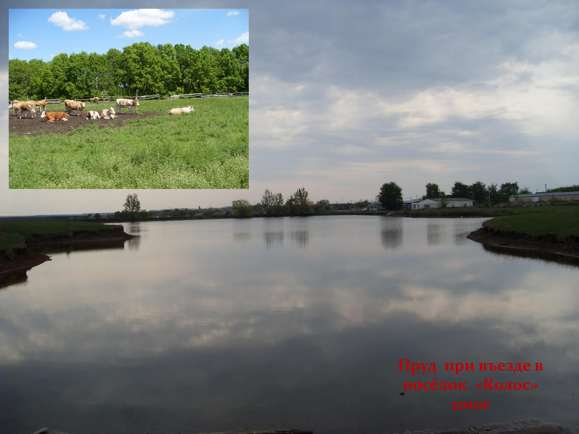
Пруд при въезде в посёлок «Колос» 2010г