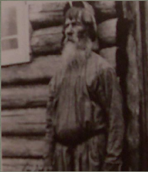
Русский крестьянин. Начало XX века.