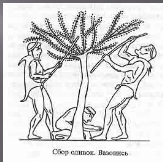
Сбор оливок. Вазонисъ.