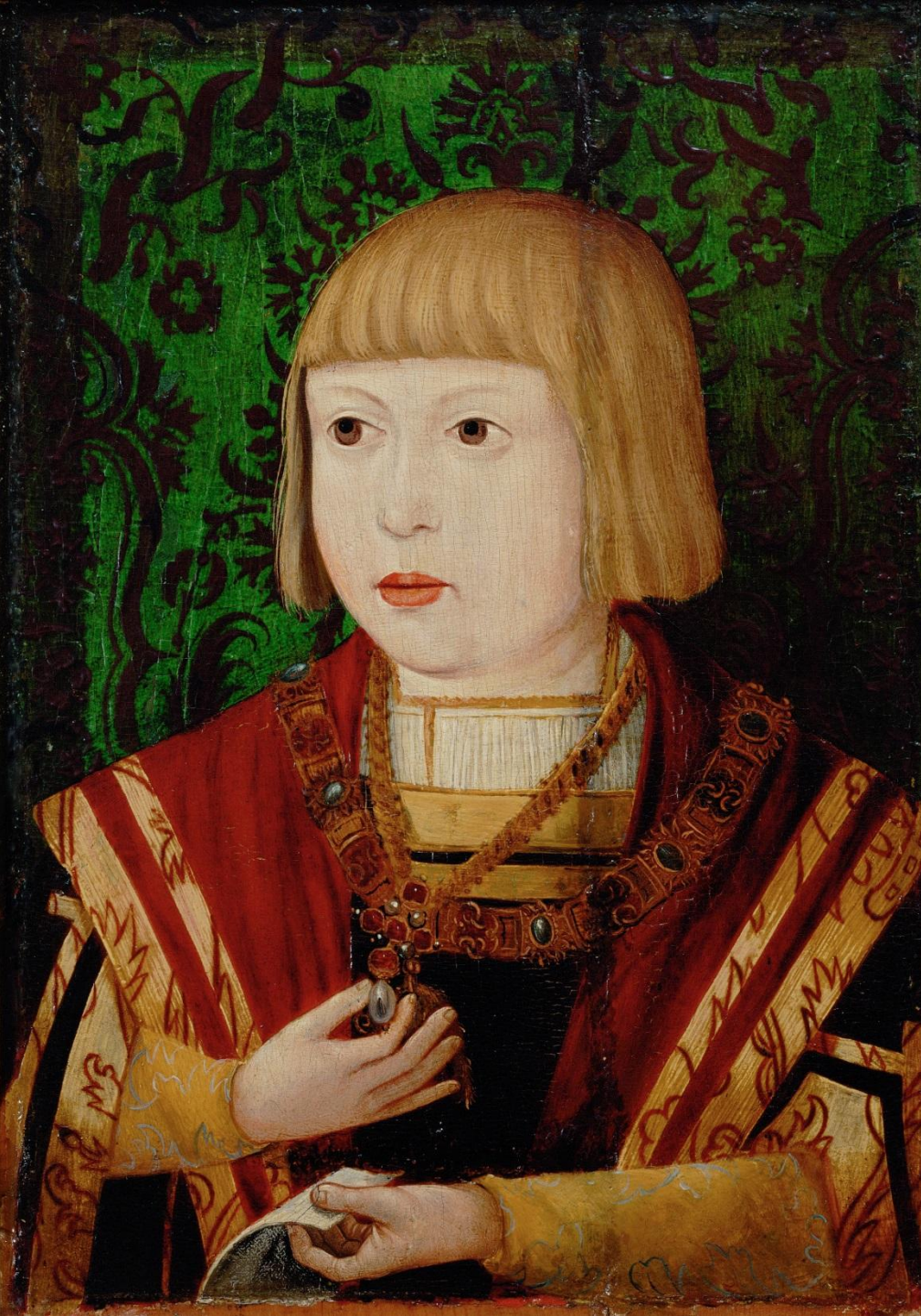
Фердинанд (сын Хуаны и Филиппа)