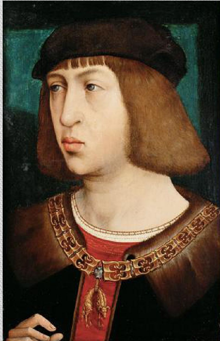
Хуан Фландес. Портрет Филиппа Красивого