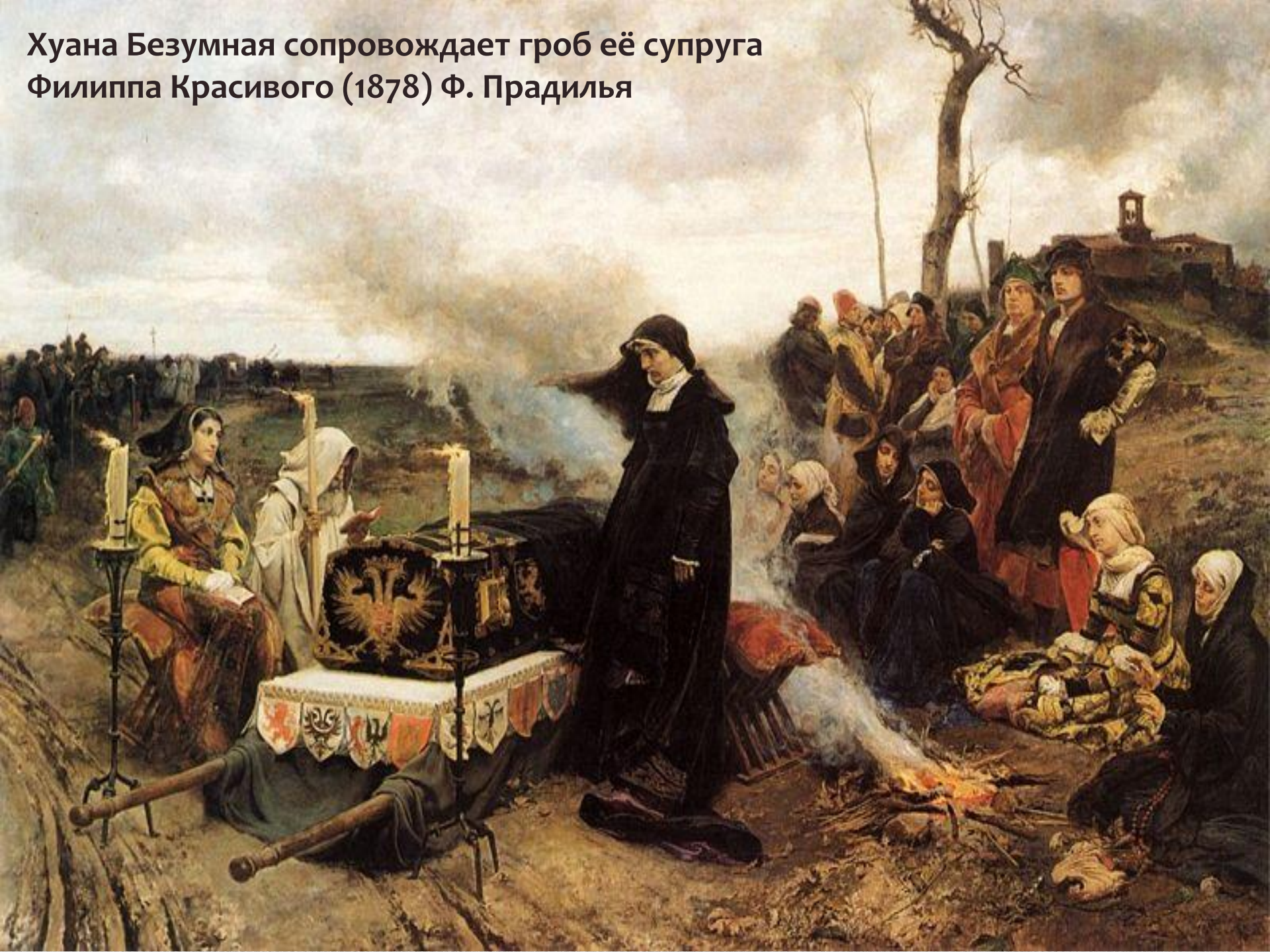
Хуана Безумная сопровождает гроб её супруга Филиппа Красивого (1878) Ф. Прадилья