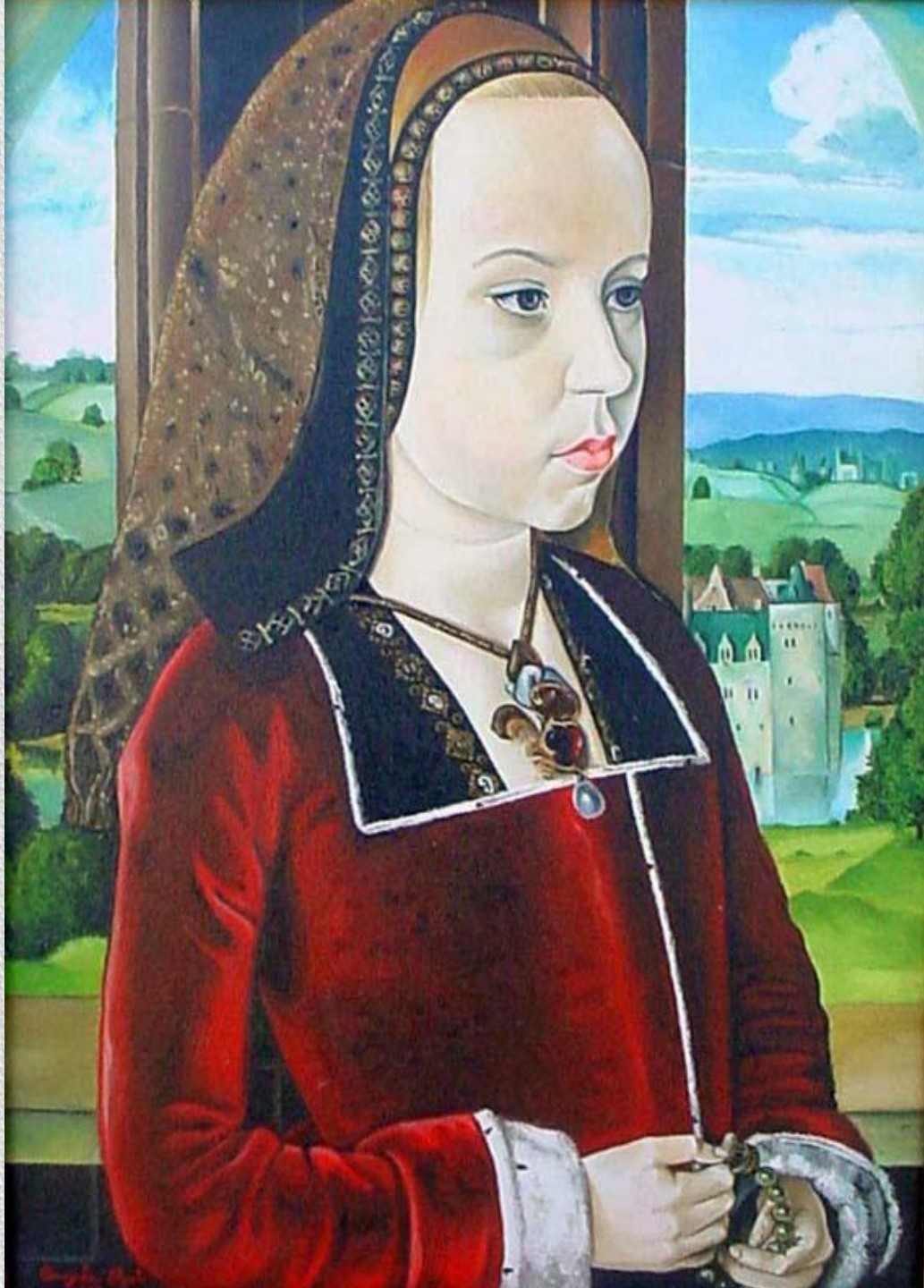
Маргарита Австрийская, будущая супруга принца Хуана