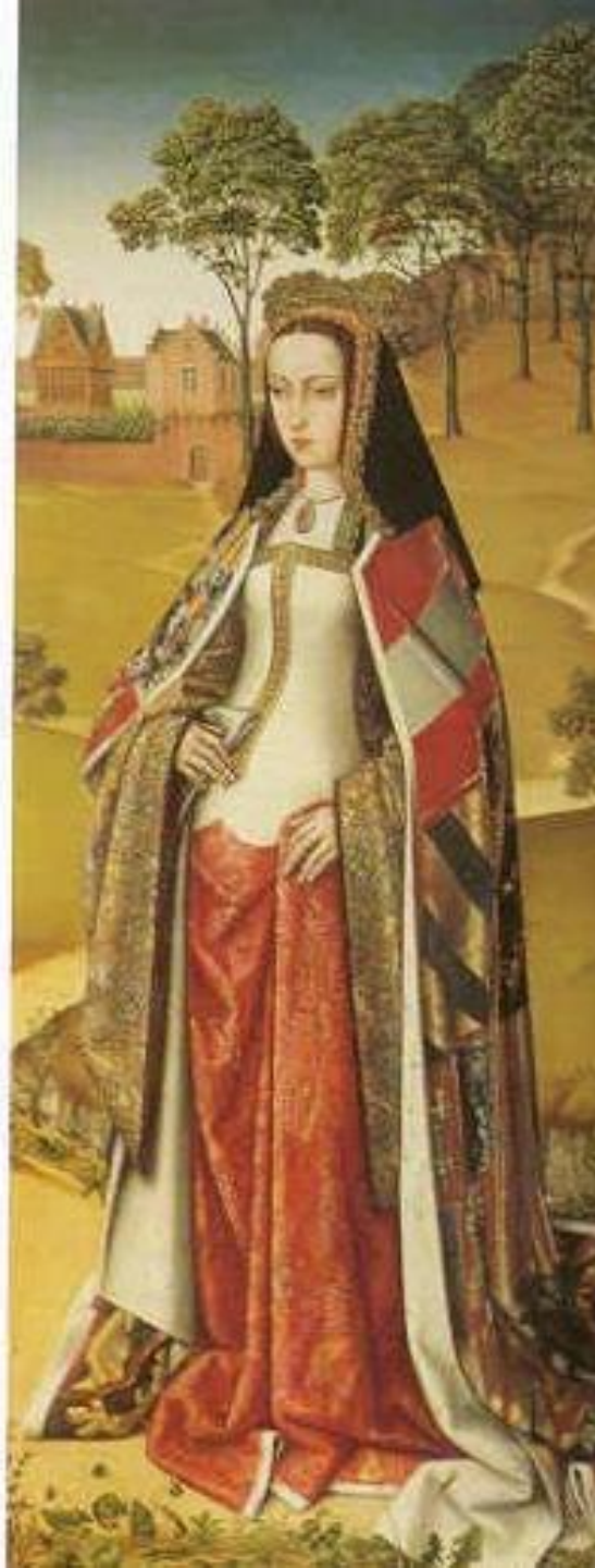
Филипп и Хуана Фландрия ок. 1500 г.