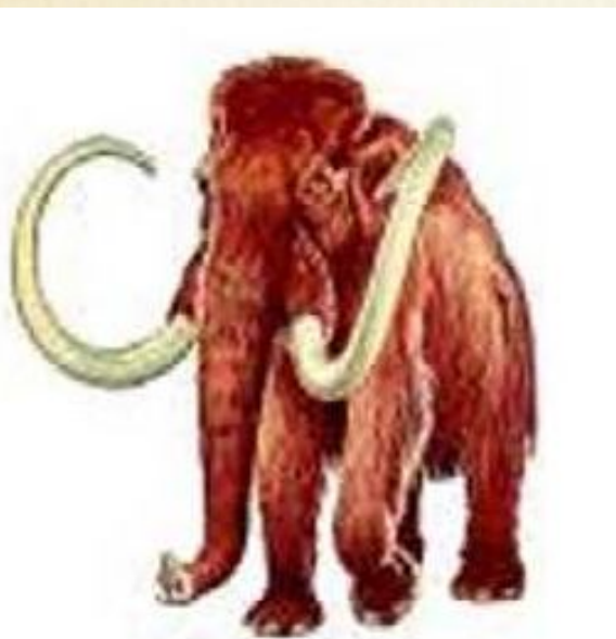
Мамонт. Рисунок нашего времени.