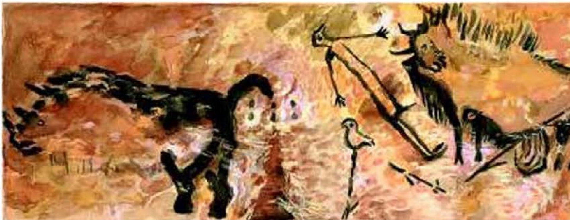
Сцена с раненым бизоном и охотником. Рисунок первобытного времени.