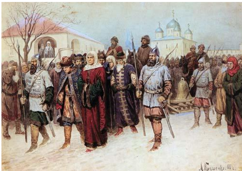
Худ. А. Кившенко. «Высылка» вечевого колокола в Москву. 1478 г.