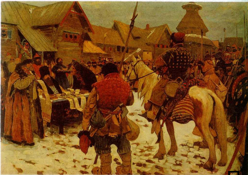
Худ. С.Иванов. Смотр служилых людей («Конно, людно и оружно»)