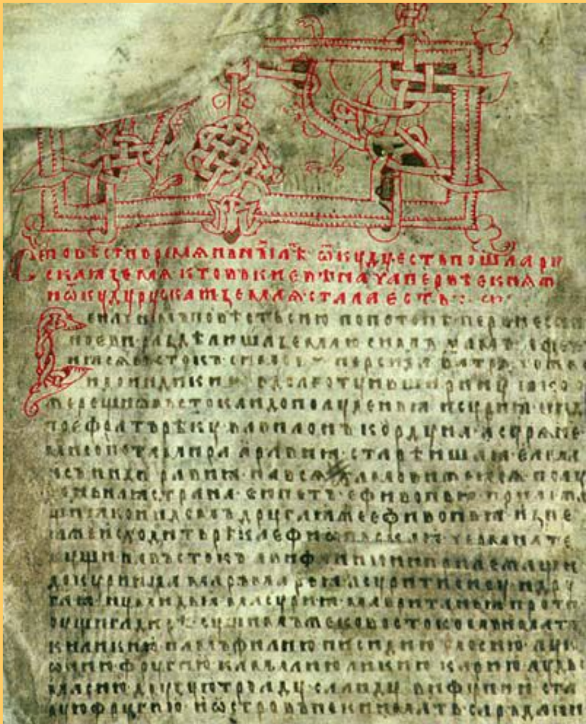
Страница Ипатьевской летописи