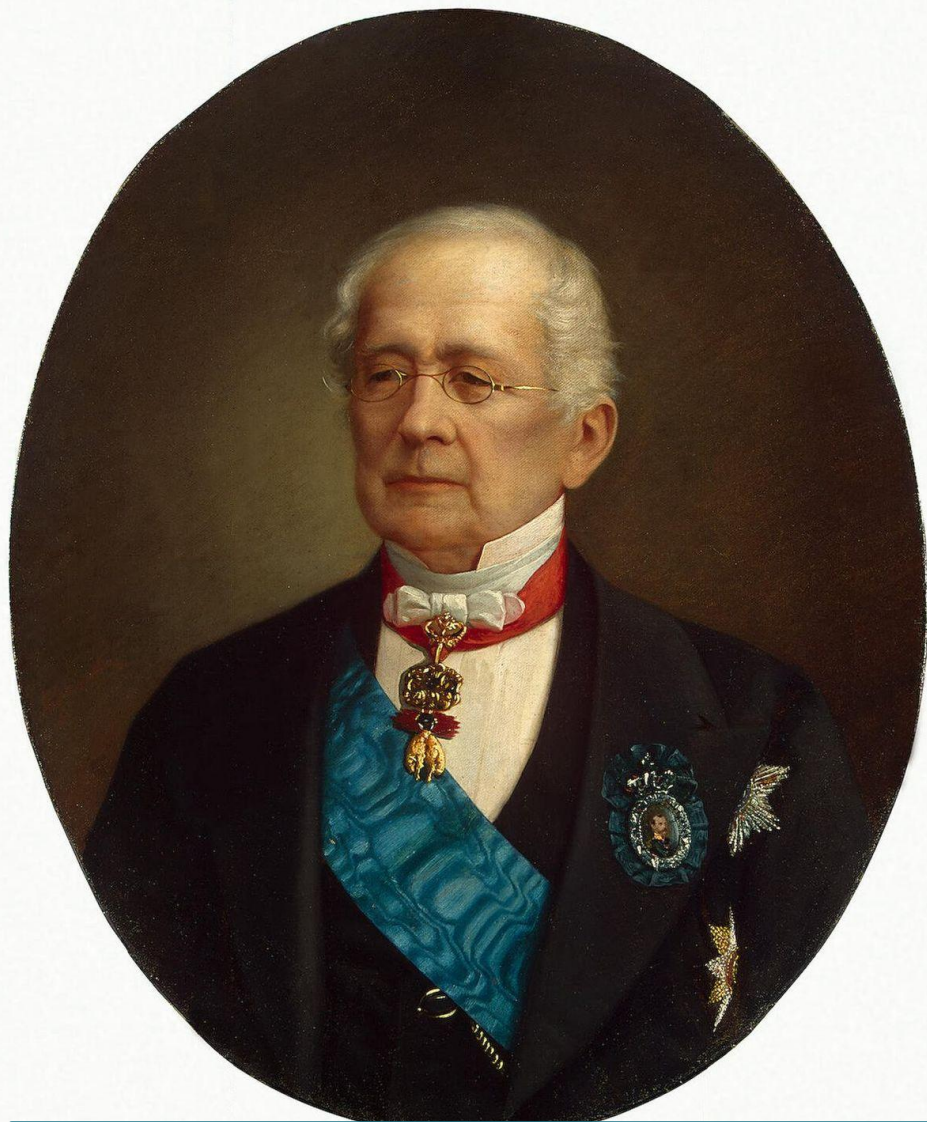
Горчаков Алексей Михайлович

Сформулировал внешнеполитическую программу: