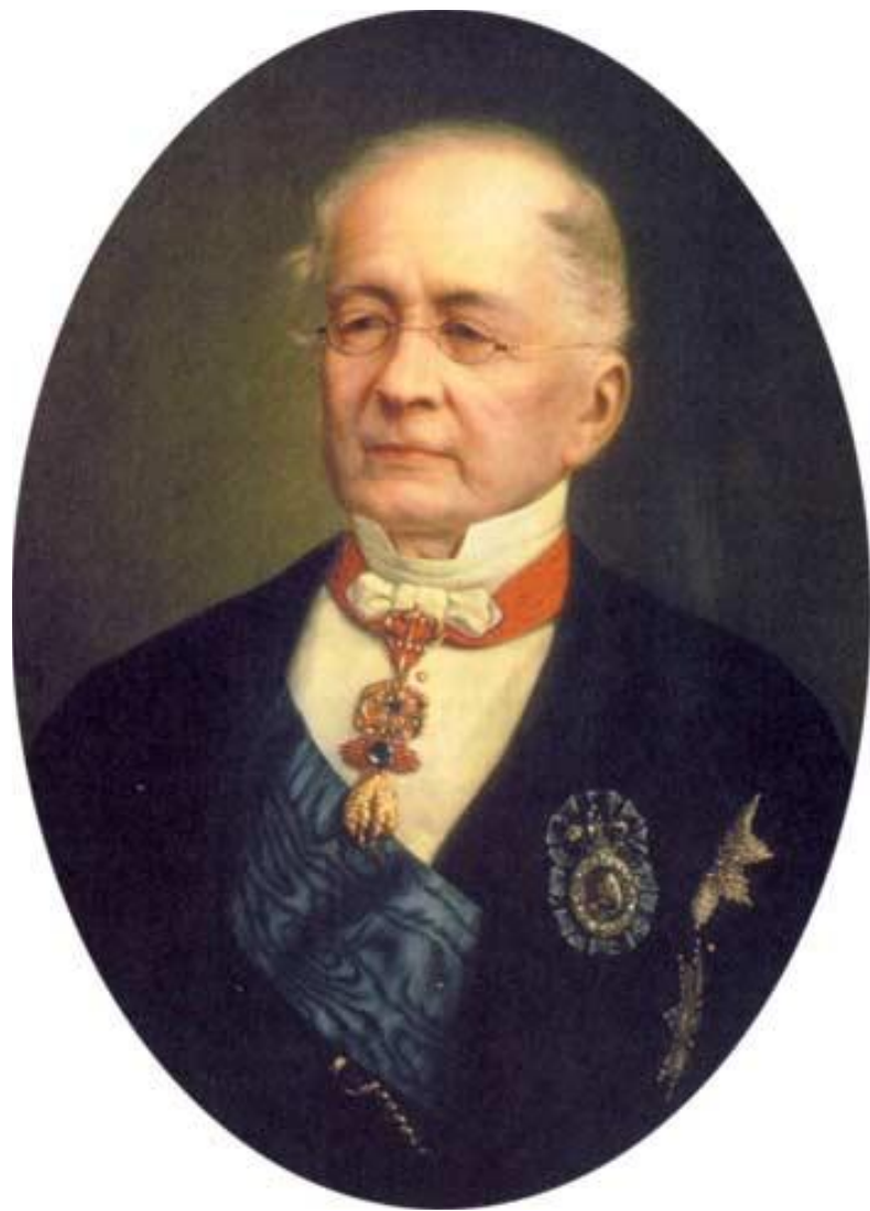
Горчаков Алексей Михайлович

Вывести Россию из международной изоляции