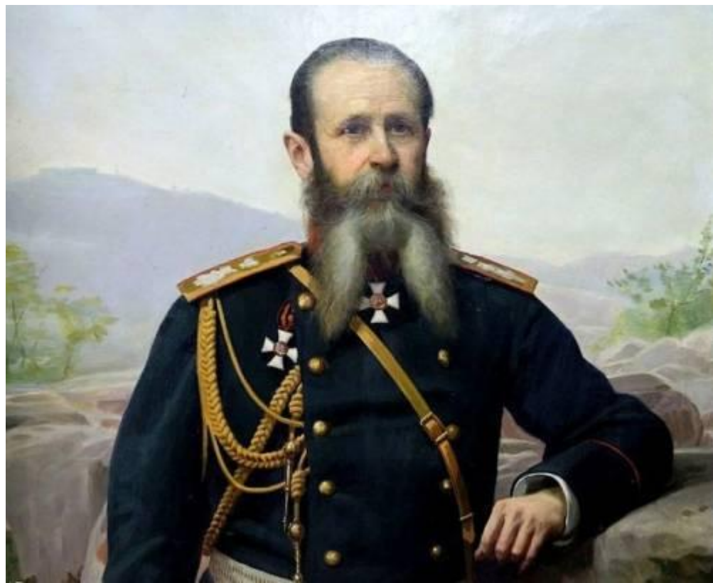
фельдмаршал Гурко Иосиф Владимирович