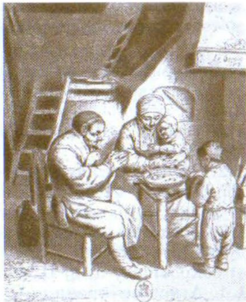
Ужин в _____ _____ семье.