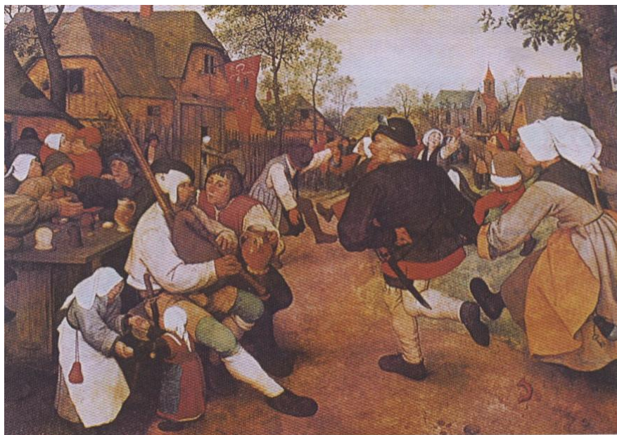
Питер Брейгель Старший (1525/1530—1569)

Крестьянский танец. 1568 г. Музей истории искусства, Вена