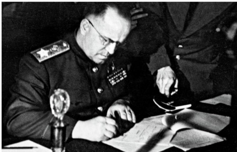
Маршал Советского Союза Георгий Константинович Жуков подписывает Акт о безоговорочной капитуляции Германии

маршалом авиации Великобритании А. Теддером от союзников, был подписан Акт о безоговорочной и полной капитуляции вермахта.