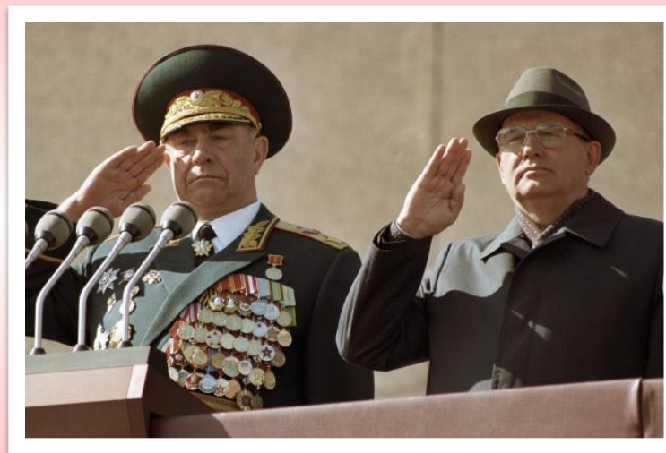
Маршал Советского Союза, министр обороны СССР Дмитрий Тимофеевич Язов и президент СССР Михаил Сергеевич Горбачев .