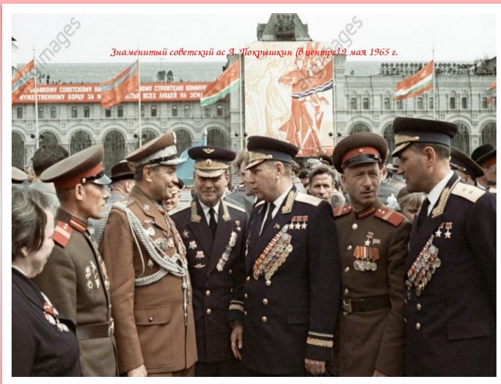
Знаменитый советский ас Александр Покрышкин (в центре) на Параде 9 мая 1965 года