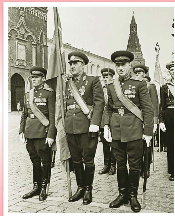
Знаменосец Герой Советского Союза полковник Константин Самсонов, ассистенты- Герои Советского Союза сержант Михаил Егоров и старший сержант Мелитон Кантария.