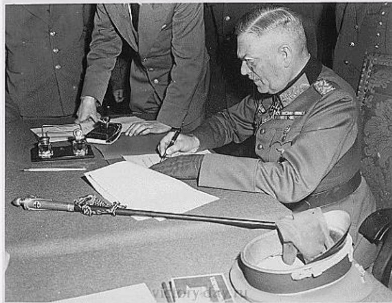
В. Кейтель подписывает Акт о безоговорочной капитуляции Германии

День Победы ведется с 9 мая 1945 года, когда в пригороде Берлина начальником штаба верховного главнокомандования генерал-фельдмаршалом В. Кейтелем от вермахта, заместителем Верховного главнокомандующего маршалом СССР Георгием Жуковым от Красной армии и