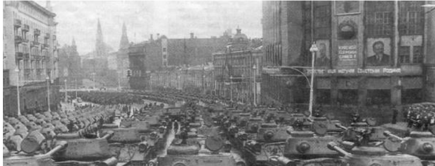
Москва 24/06/1945 Парад Победы

По Красной площади торжественно прошагали сводные полки фронтов. Знамена соединений несли Герои Советского Союза и другие орденосцы. За ними двигалась колонна солдат особого батальона из числа героев Советского Союза и других особо отличившихся в боях солдат. Они несли знамена и штандарты поверженной фашистской Германии, которые бросили к подножью Мавзолея и подожгли.