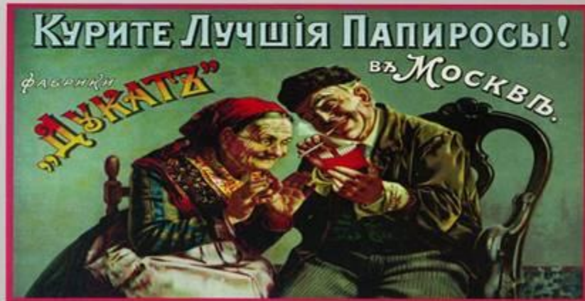
Реклама 20-х годов.

Они были лишены избирательных прав, не могли вступать в профсоюзы, но в то же время обладали высокими доходами.