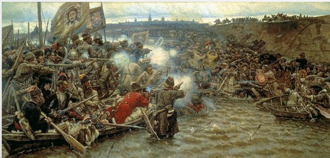
В. Суриков. Покорение Сибири Ермаком