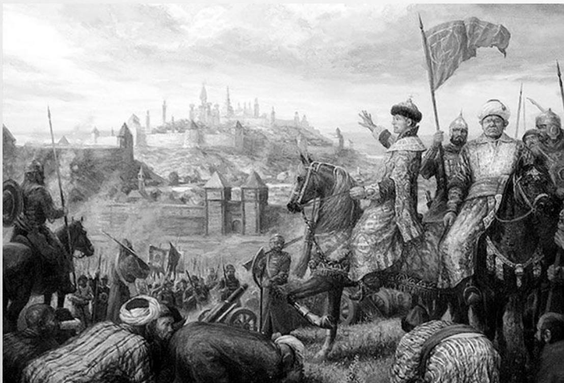
Иван IV и шах Али перед штурмом Казани