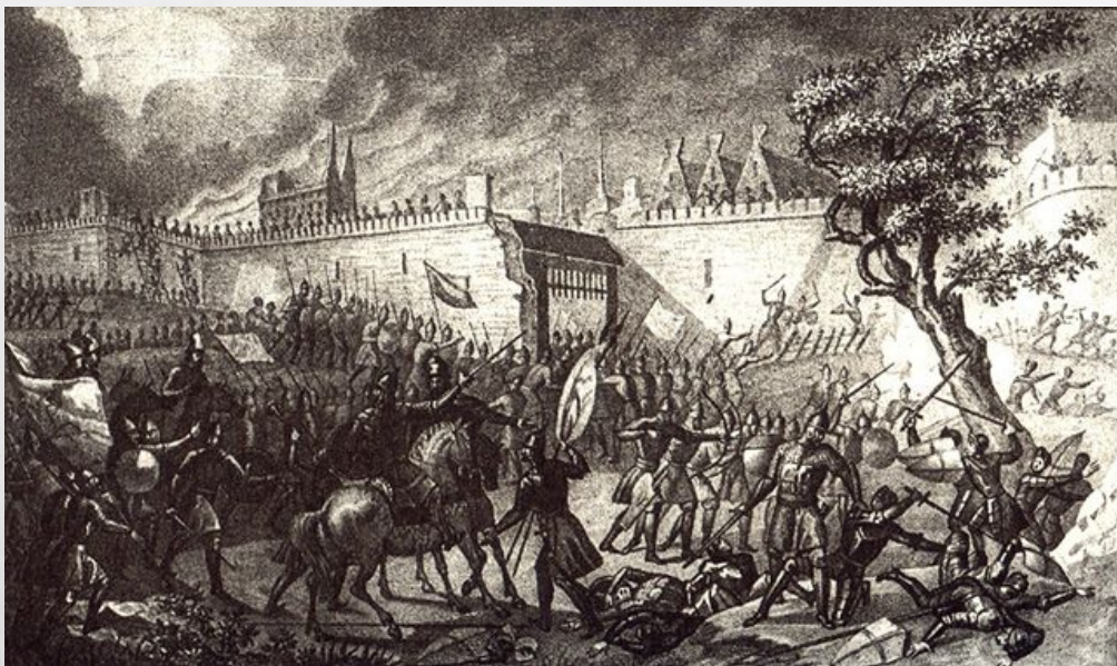
Взятие Нарвы Иваном Грозным