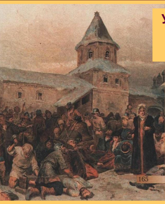
Уничтожение новгородской вольницы при Иване III. Худ. К. Лебедев

Вечевой колокол увезли Москву. 1480г.- арестовано 250 бояр и купцов за связи с поляками. 100 казнили, остальных перевезли в Москву. Их место заняли переселенцы из Москвы.