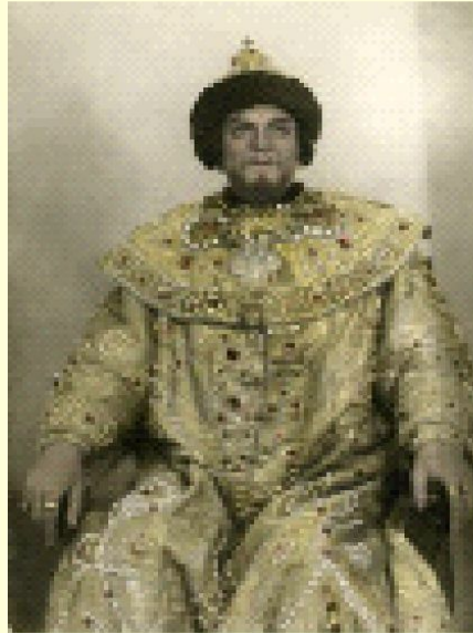
Шапка Мономаха – царский венец