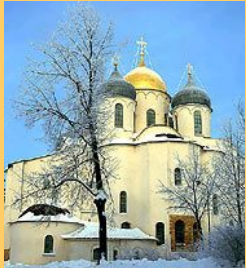
Храм Святой Софии

В 1570г. царь с войском опричников отправился в Новгород, для того чтобы подчинить своей власти этот город. Русь от г. Клина до г.Новгорода превратилась в пожарища и пустыню, всё было разорено и разграблено.