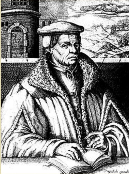
Томас Мюнцер (1489 – 27.05. 1525г.)

Призывал к ниспровержению феодального строя и установлению справедливого порядка.