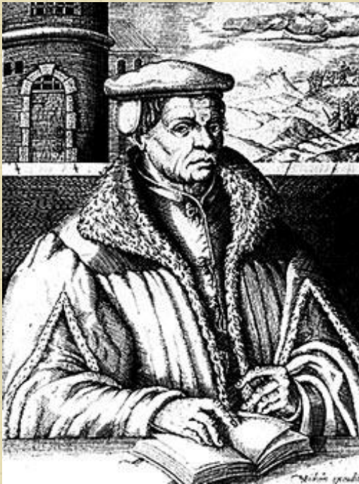
Томас Мюнцер (1489 – 27.05. 1525г.)

Призывал к ниспровержению феодального строя и установлению справедливого порядка.