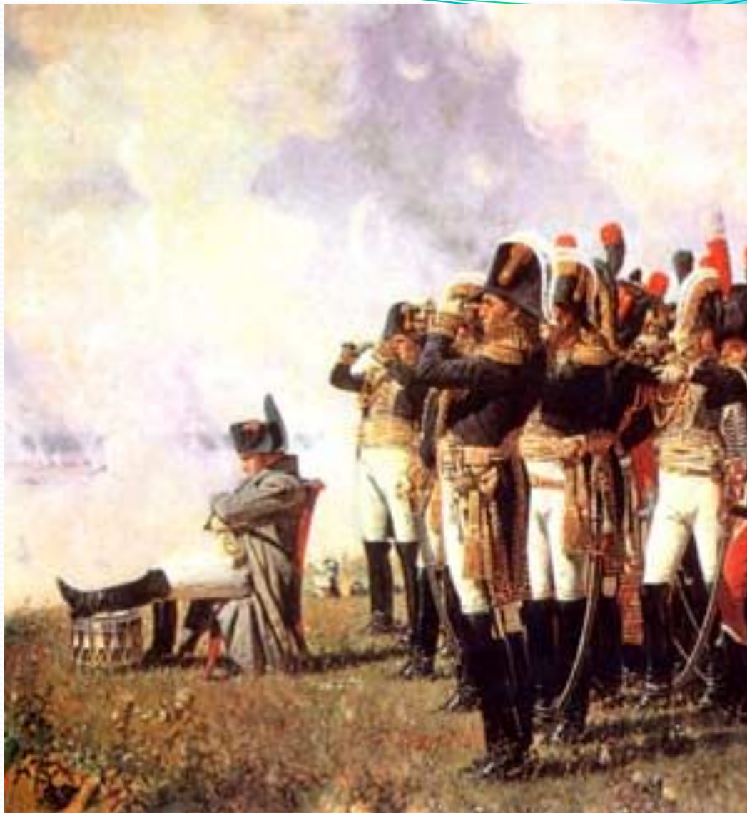
Наполеон и его армия