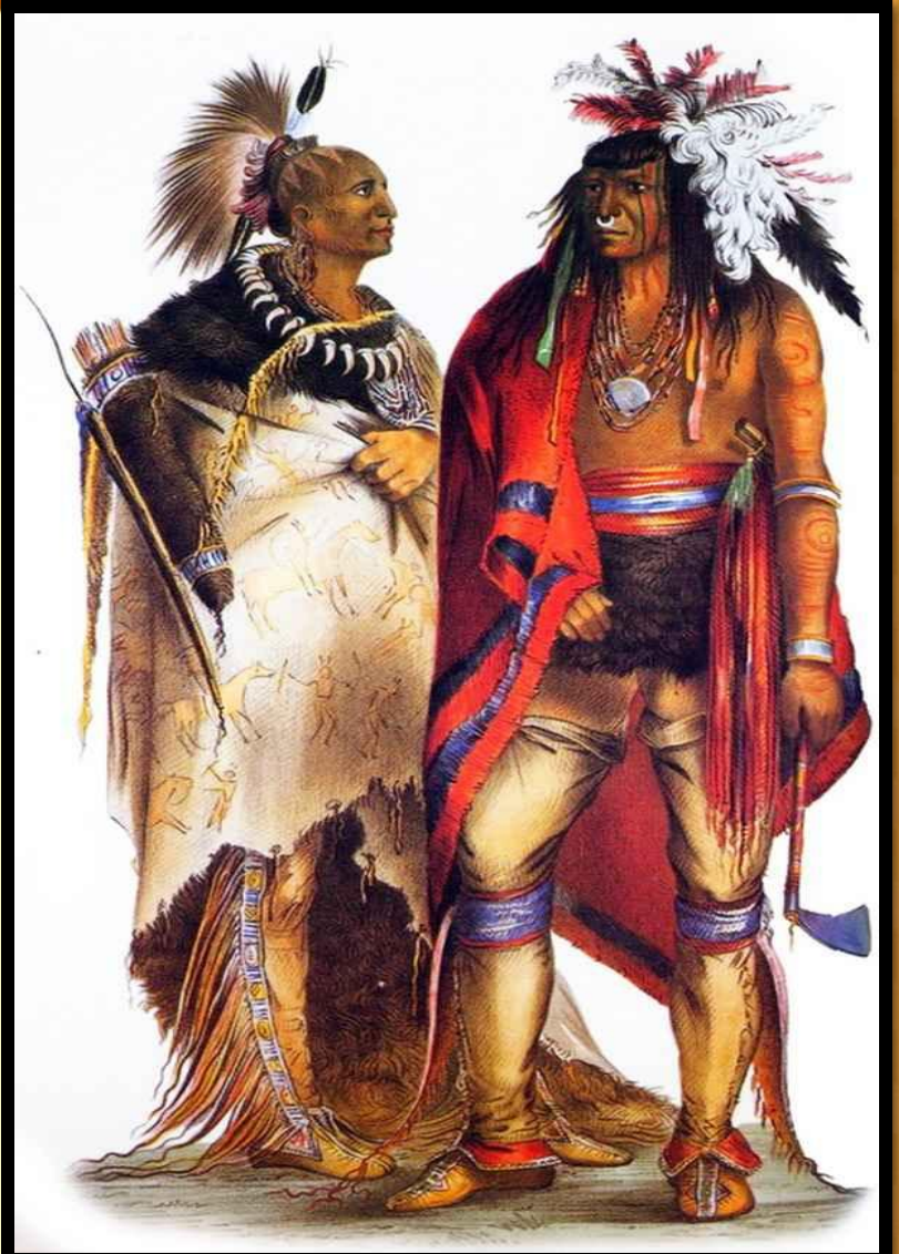
Ирокезы – воины

? Какую политику проводили переселенцы по отношению к индейцам, какую реакцию эта политика вызвала у индейцев?