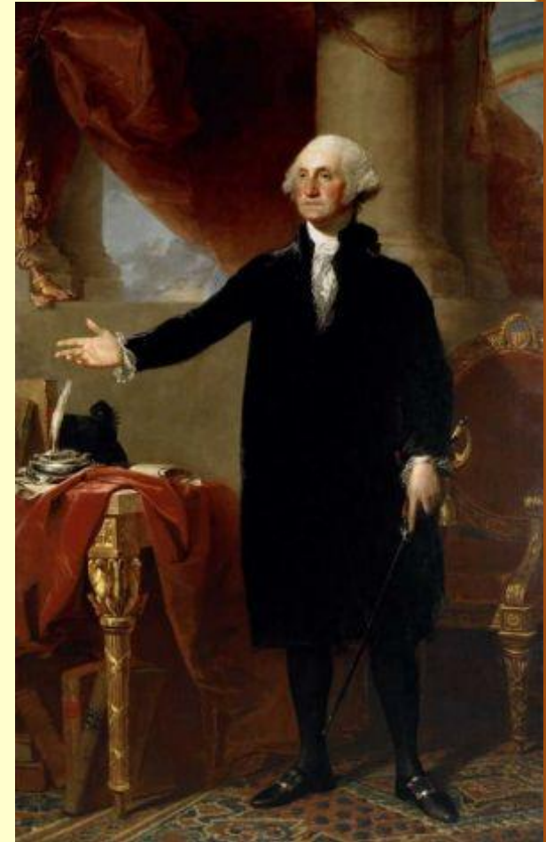
Первый президент – Джордж Вашингтон