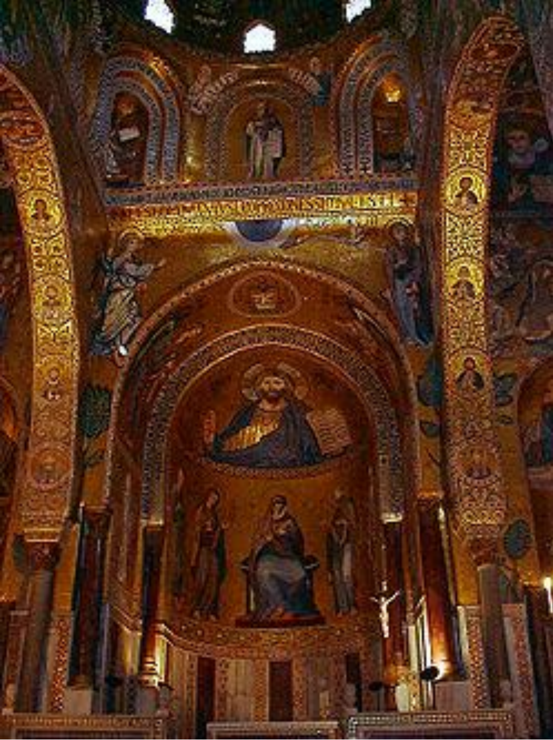
Палатинская капелла. Италия