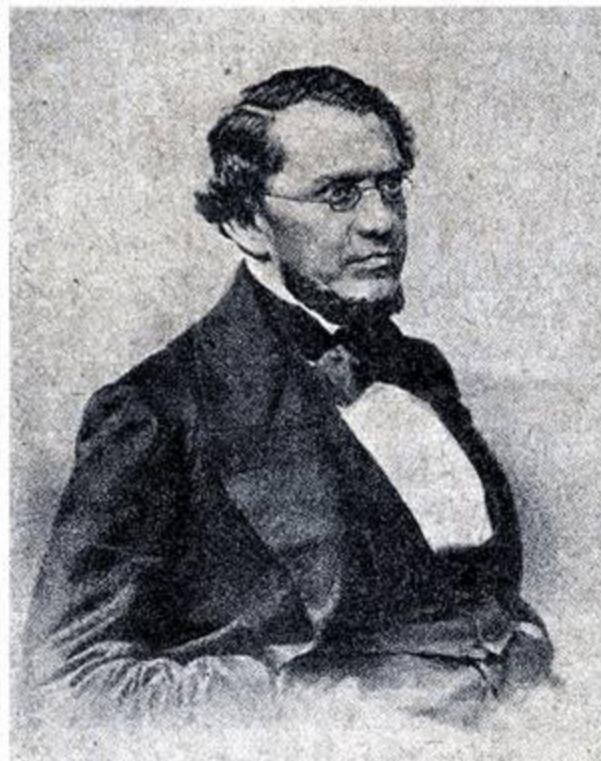
К. Д. Кавелин.