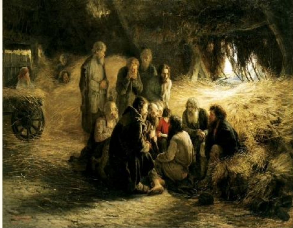
Мясоедов Г.Г. «Чтение Манифеста 19 февраля 1861 г»

Но к осени 1861 г. крестьянское движение пошло на убыль.