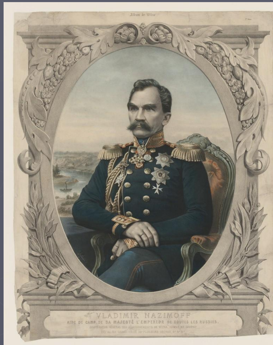
VLADIMIR NAZIMOFF AIDE DE CAMP DE SA MAJESTÉ L'EMPEREUR DE TOUTES LES RUSSIES. SOUVERAINEUR GENERAL DES GOUVERNEMENTS DE VIENNE, TOWN AND GRODNO CITIZEN GRAND-CROIX DE PLUSIEURS ORDRES, &c. &c.