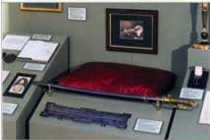
ГОСУДАРЬ ИМПЕРАТОРА АЛЕКСАНДРА НИКОЛАВИЧА