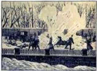
Государь Императора Александра Николаевича