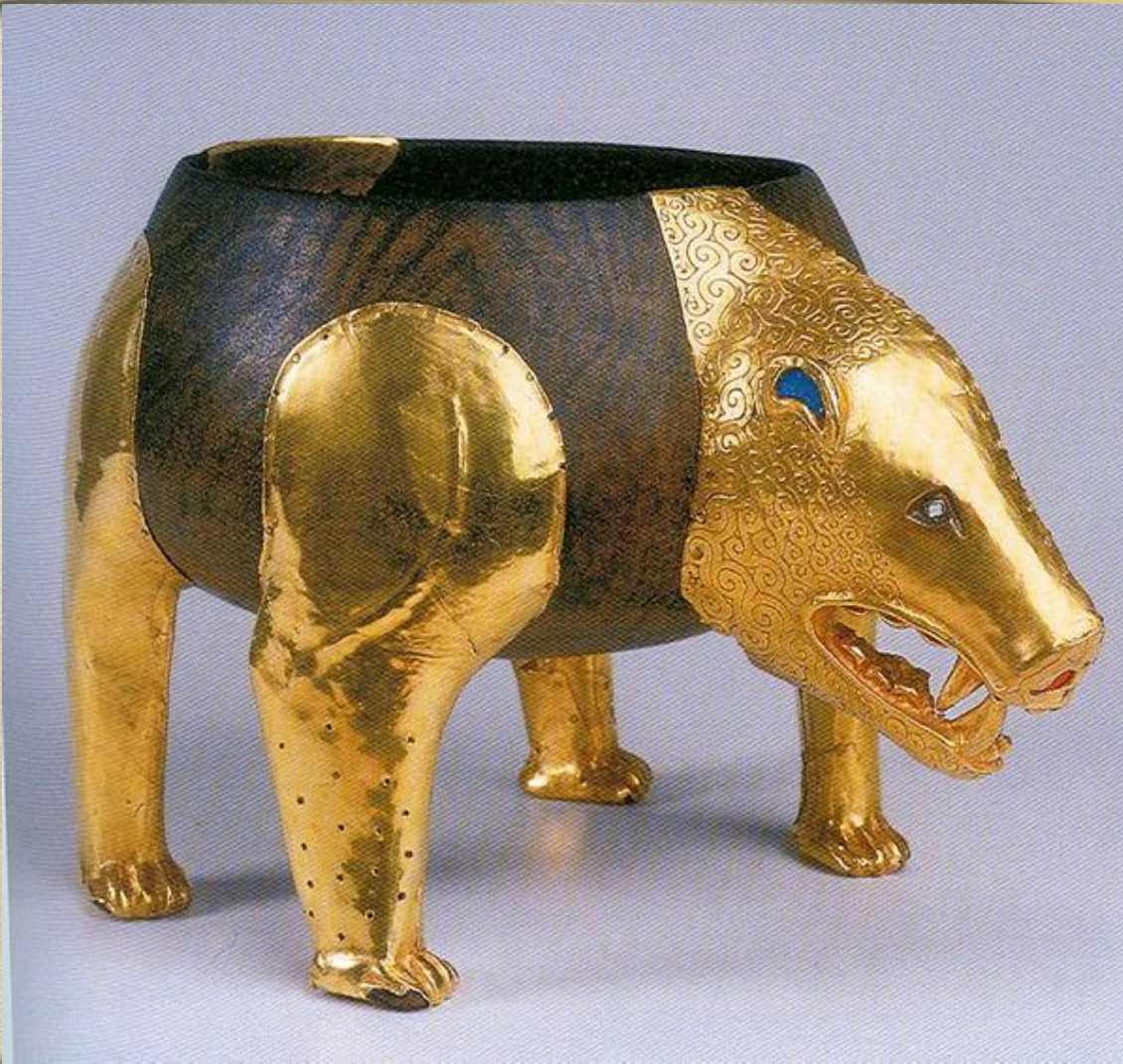
Деревянный сосуд в виде фигурки медведя. Золото, смальта. IV в. до н.э.