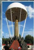
Этот памятник посвящен десантникам, погибшим в Чечне. Полоски под куполом парашюта скопированы из их военных билетов.